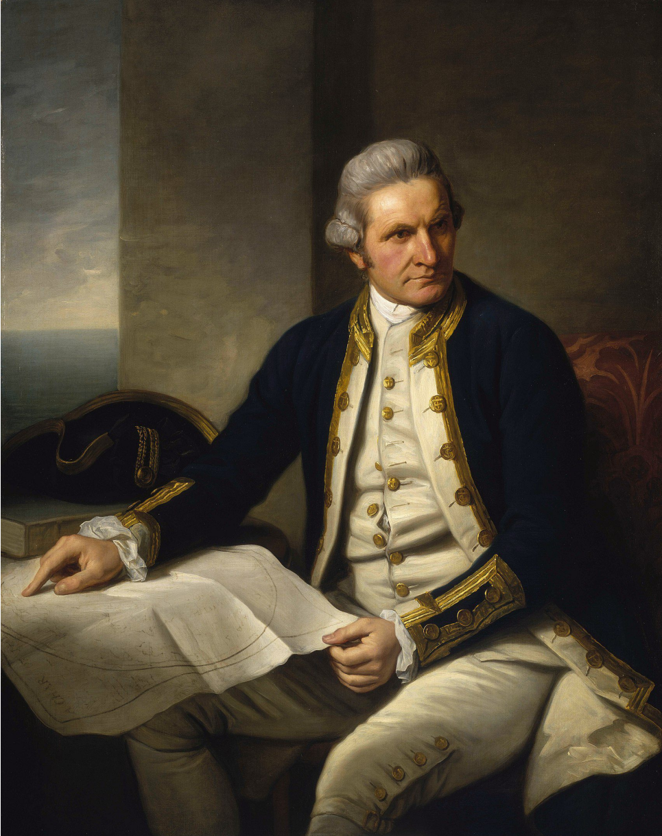
James Cook (1728-1779).

Il est probable qu'en 1788, l'expédition française conduite par La Pérouse reconnaît la côte Ouest à bord de La Boussole et de L'Astrolabe , juste avant de sombrer dans un naufrage sur le récif de Vanikoro aux Îles Salomon. En juin 1792, le contre-amiral français Antoine Bruny d'Entrecasteaux, parti en 1791 à la demande de Louis XVI pour retrouver La Pérouse, passe au large de l'île des Pins et la côte Sud de la Grande Terre, puis reconnaît en avril et mai 1793 la côte Ouest de la Grande Terre et se serait arrêté notamment aux Îles Loyauté. Néanmoins, on attribue la découverte de ces dernières à l'explorateur français Jules Dumont d'Urville en 1827 puis 1840 qui fut le premier à les situer précisément sur une carte.