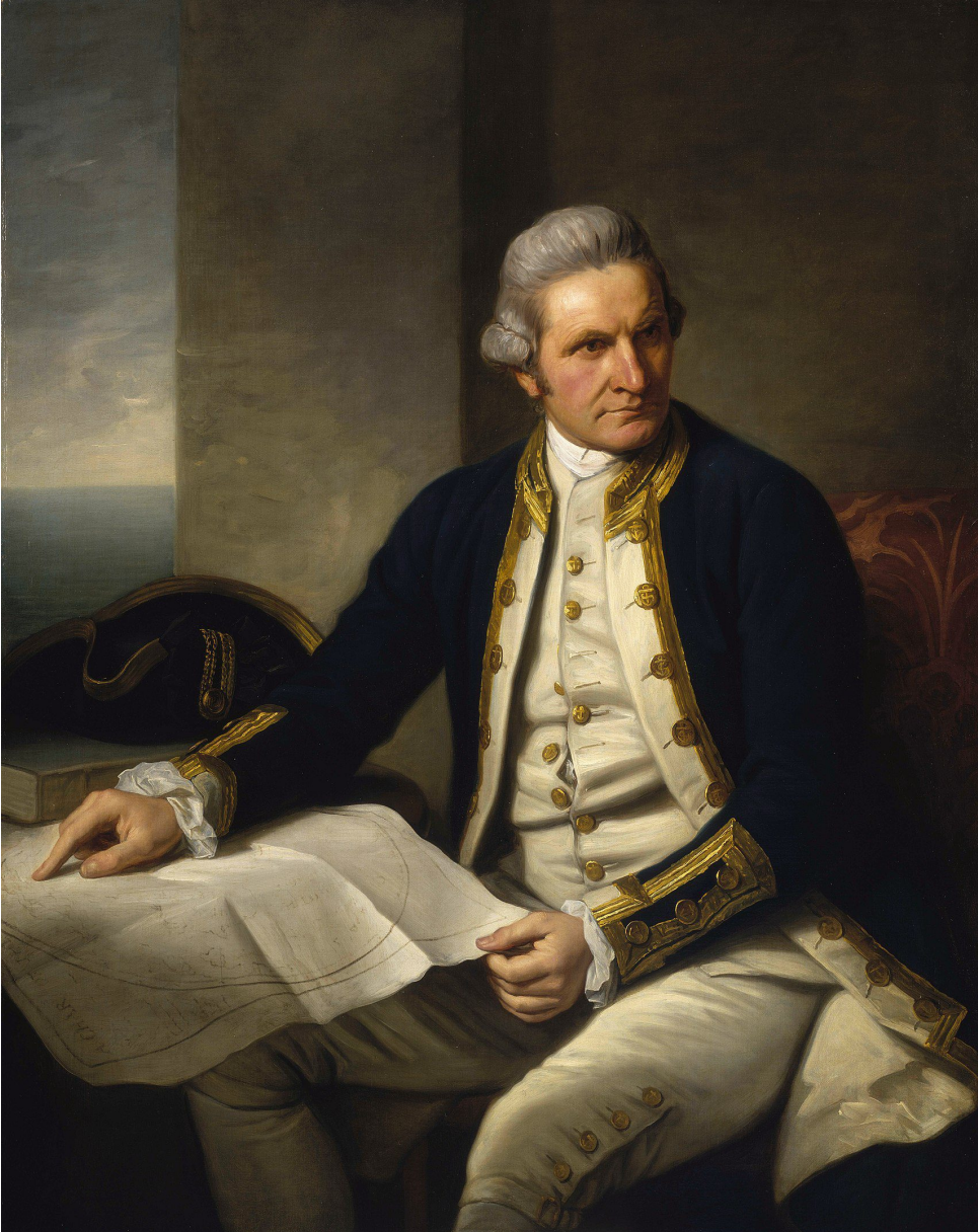
James Cook (1728-1779).

Il est probable qu'en 1788, l'expédition française conduite par La Pérouse reconnaît la côte Ouest à bord de La Boussole et de L'Astrolabe , juste avant de sombrer dans un naufrage sur le récif de Vanikoro aux Îles Salomon. En juin 1792, le contre-amiral français Antoine Bruny d'Entrecasteaux, parti en 1791 à la demande de Louis XVI pour retrouver La Pérouse, passe au large de l'île des Pins et la côte Sud de la Grande Terre, puis reconnaît en avril et mai 1793 la côte Ouest de la Grande Terre et se serait arrêté notamment aux Îles Loyauté. Néanmoins, on attribue la découverte de ces dernières à l'explorateur français Jules Dumont d'Urville en 1827 puis 1840 qui fut le premier à les situer précisément sur une carte.