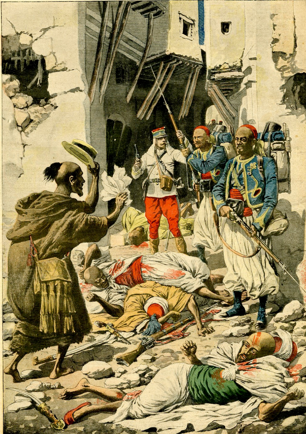
A CASABLANCA. — APRÈS LE BOMBARDEMENT Les patrouilles parcourent la ville