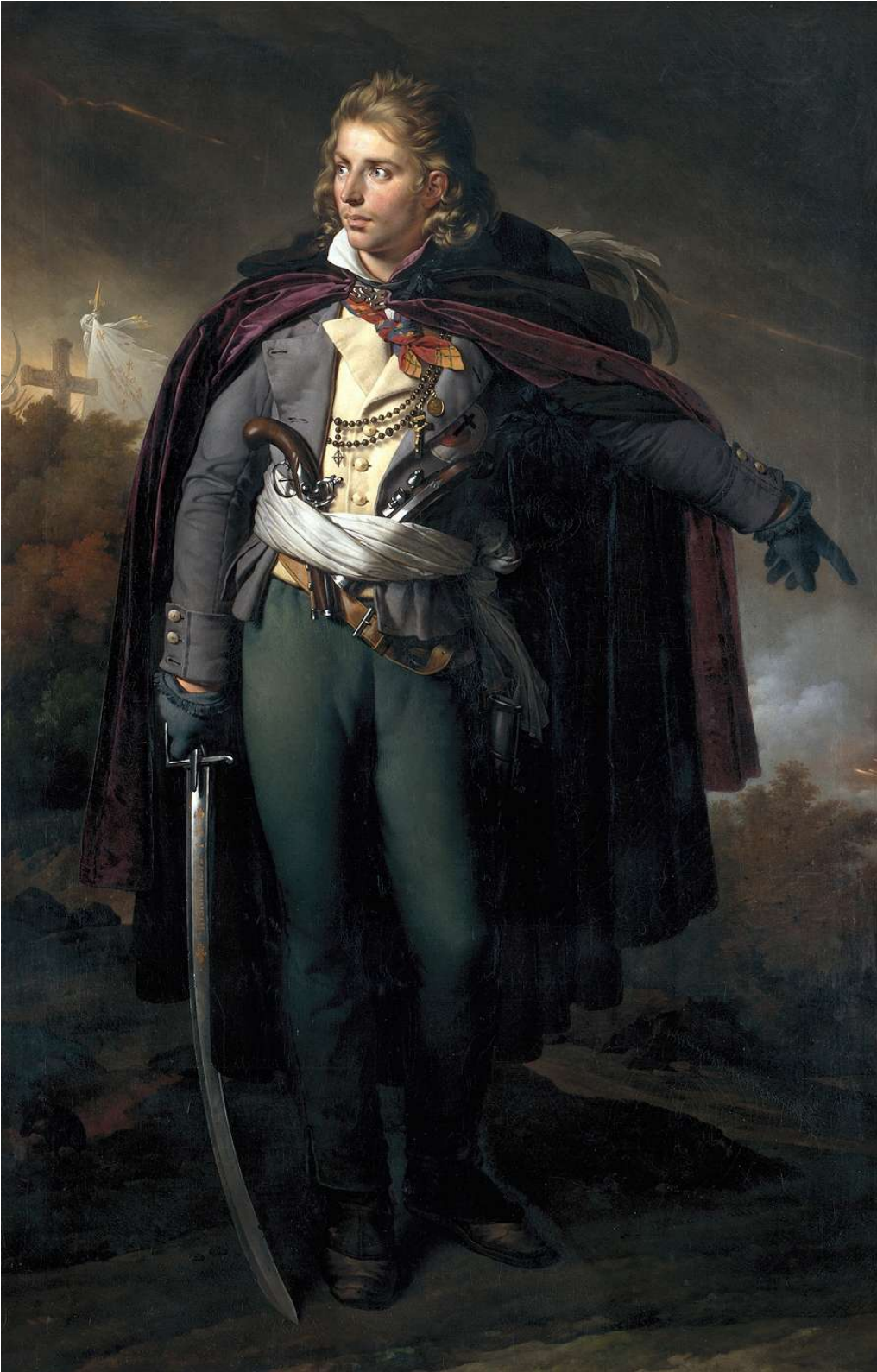
Le 4 février 1777, Jacques Cathelineau épouse Louise Godin, de neuf ans son aînée. Ils ont onze enfants dont six