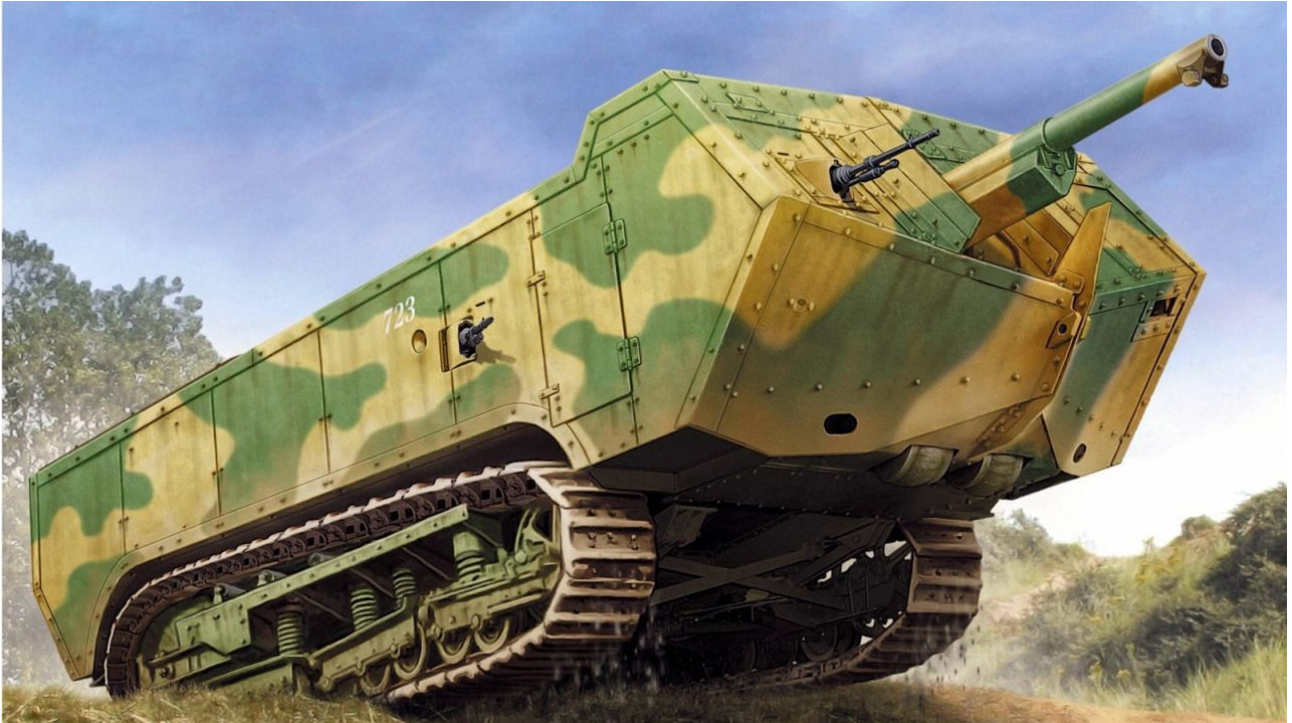
Char Saint Chamond