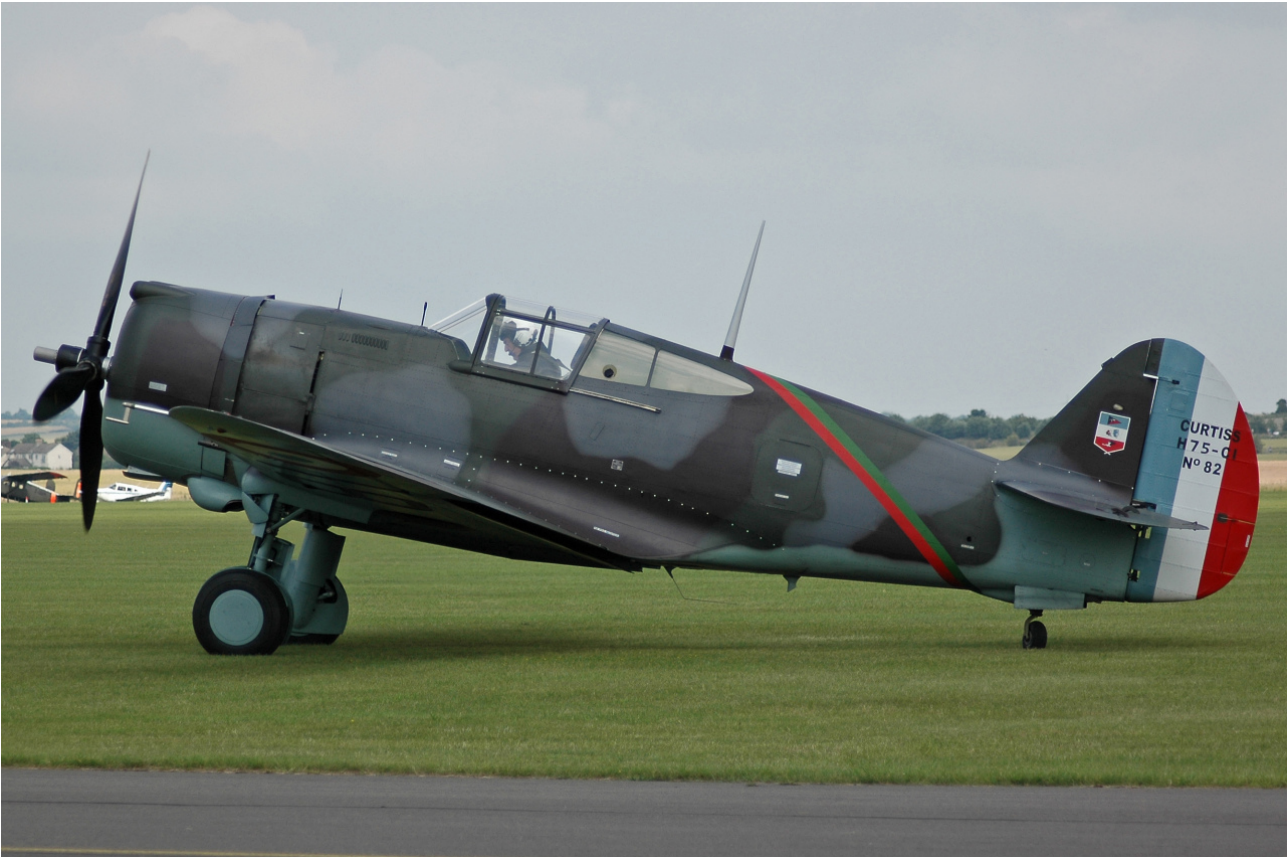
Le Curtiss H.75A-1 no 82 restauré aux couleurs françaises par The Fighter Collection.

le Commonwealth britannique (où il était surnommé Mohawk ), par l'Argentine, le Brésil, la Chine, l'Iran, la Norvège, les Pays-Bas, le Pérou, le Portugal et la Thaïlande. La Finlande en employa également plusieurs douzaines contre l'Union soviétique. Près de mille appareils furent produits.