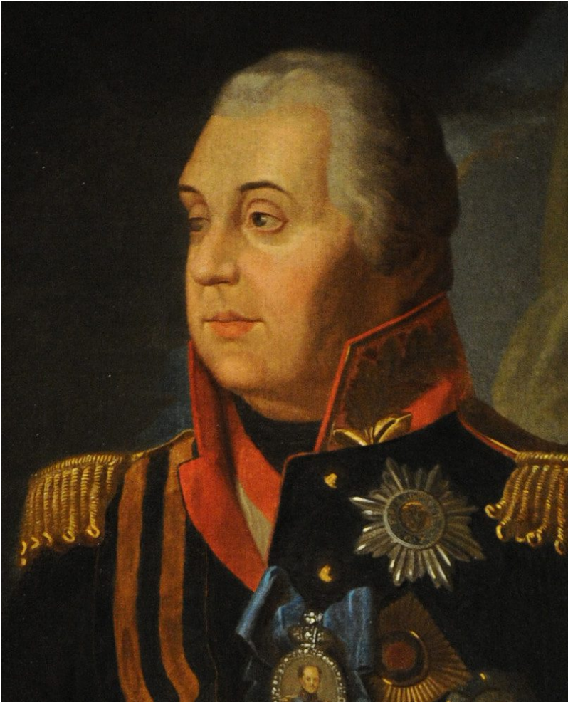
Mikhaïl Koutouzov (1745-1813).

Koutouzov attend cependant que les Français, dont les forces comptent aussi d'importants contingents étrangers, soient à 125 km de Moscou pour accepter la bataille. Le 30 août, il ordonne une nouvelle retraite à Gjatsk. Le rapport de force reste à l'avantage des Français, mais il est désormais de cinq contre quatre au lieu de trois contre un auparavant. Koutouzov établit alors sa ligne défensive dans une zone facile à défendre, près du village de Borodino. À partir du 3 septembre, Koutouzov renforce la position avec des travaux de terrassements, notamment la redoute Raïevski dans le centre droit russe et les « flèches » de Bagration sur la gauche.