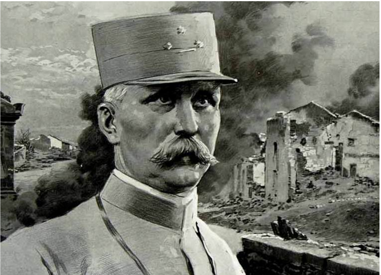
Illustration du général Pétain parue dans le journal britannique « The Sphere » du 18 mars 1916.

Le général Pétain ayant ordonné de tenir coûte que coûte la ligne Malancourt-Béthincourt, le 92 e RI monte à l'assaut du bois de Cumières qui en constitue le principal point d'appui. Le colonel Macker en tête, le régiment monte à l'assaut et franchit les 400 mètres le séparant de l'ennemi. Une fois les positions allemandes saisies, le régiment est immédiatement relevé. Pendant ce temps les Allemands s'emparent de l'ouvrage d'Hardaumont sur la rive droite.