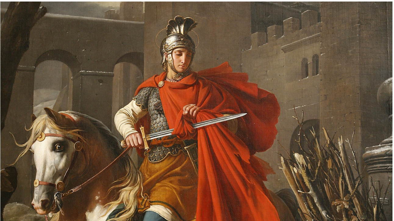
Saint-Martin de Tours.

Lire la note dédiée sur TB : 8 novembre 397 : mort de Saint Martin de Tours, soldat romain devenu évêque