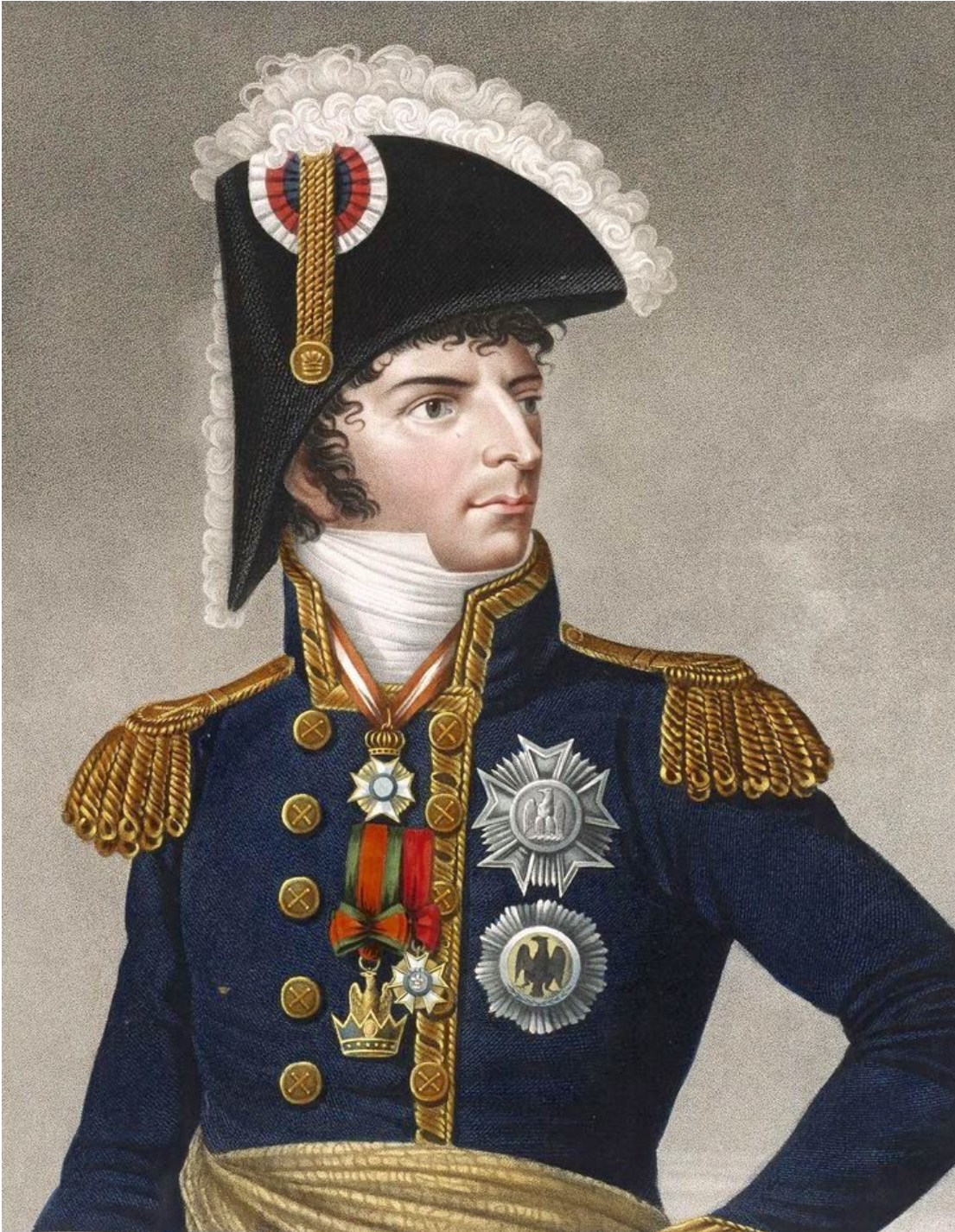
Maréchal Jean-Baptiste Bernadotte, commandant en chef le 1er corps de la Grande Armée.

Informé des préparatifs de guerre prussiens, Napoléon annonça le 5 septembre la levée de 50 000 conscrits de la classe 1806 et mit les troupes stationnées sur le territoire allemand en état d'alerte. Lorsqu'il sut que l'armée saxonne avait fusionné avec son homologue prussienne,