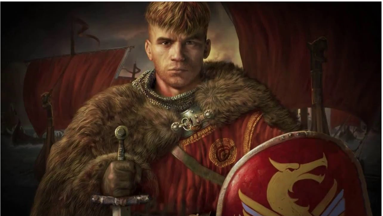
Guillaume Le Conquérant

Dès lors, il passe la suite de son règne à se défendre face à ses nombreux ennemis, que ce soit en Angleterre (les rebelles anglo-saxons rassemblés derrière Edgar Atheling, les Danois et les Écossais) ou sur le continent (le comte d'Anjou Foulques le Réchin, le comte de Flandre Robert 1 er , et surtout le roi de France Philippe 1 er ). Il meurt à Rouen en 1087, après la mise à sac de Mantes, au cours d'une campagne de représailles dans le Vexin français contre le roi Philippe 1 er . Il est inhumé à l'abbaye aux Hommes de Caen.