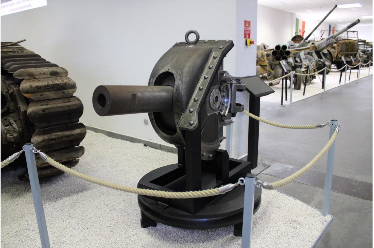
Canon du B1 bis.

connaissances précises qu'il a bien voulu partager pour l'écriture de cet article.