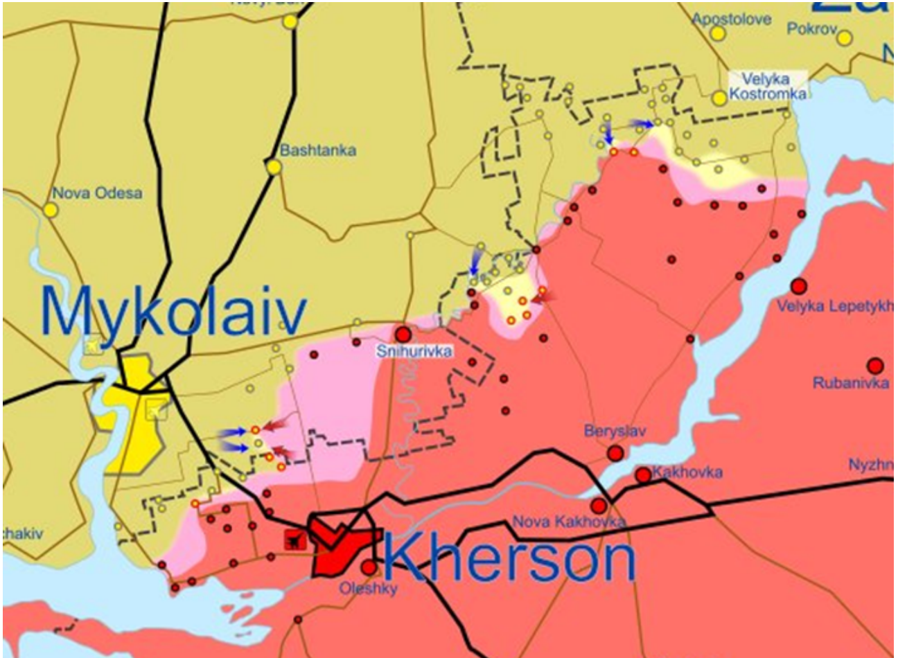
Situation autour de Kherson au 09 septembre

Enfin, au centre, les Ukrainiens sont partis de la ligne avancée qu'ils avaient conquise à grand peine pendant l'été, lors d'une précédente opération offensive qui avait été stoppée rapidement. Attaquant légèrement à côté de l'axe de la route qui mène à Beryslav, ils ont formé un saillant d'une douzaine de kilomètres de profondeur et un peu moins de large. La progression semble être sinon stoppée, au moins considérablement ralentie par les Russes. Sur le plan de la communication, Kyiv a joué cette fois la carte de l'opacité totale, laissant planer de sérieux doutes sur l'endroit précis, l'heure, les effectifs, les axes de progression, les moyens... Bref on est revenu à quelque chose de plus classique et, dans un sens, de plus logique : dans ce genre d'opération délicate, moins on en dit, mieux on se porte.