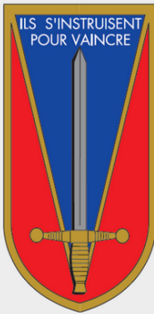
ÉCOLE SPÉCIALE MILITAIRE DE SAINT-CYR

pour la filière encadrement. Elle est désormais sanctionnée par l'attribution d'un mastère spécialisé « commandement et leadership », qui renforce son attractivité et reconnaît la qualité de la formation dispensée.