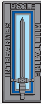
ÉCOLE MILITAIRE INTERARMES