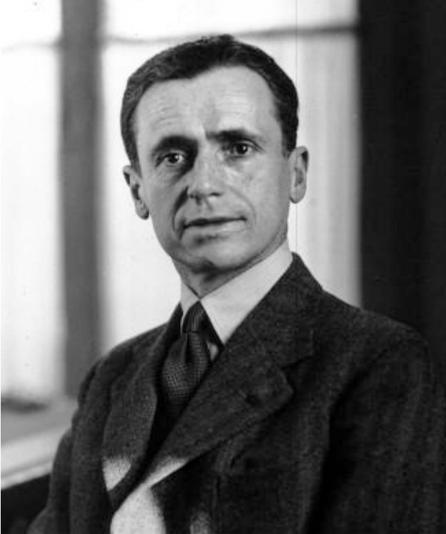
Henri de Kérillis (1889-1958).

Dans le monde politique, la SFIO porte au pinacle cet esprit pacifiste, dont le chantre est Paul Faure, même si Léon Blum oscille sans cesse entre son ardente volonté de paix et sa volonté lucide d'arrêter Hitler. Au groupe parlementaire, les partisans des accords de Munich l'emportent et la discipline de vote entraîne les socialistes, à une exception près, à les approuver avec une droite également quasiment unanime (seul Henri de Kérillis a voté contre), et, avec la même discipline de vote, les 73 députés communistes refusent quant à eux de reconnaître les accords de Munich. Le Front populaire a explosé, pris dans l'étau de la contradiction entre le pacifisme et la lutte antifasciste. Suivant la ligne ordonnée par Moscou, le PCF s'est montré la force politique la plus opposée à la capitulation munichoise.