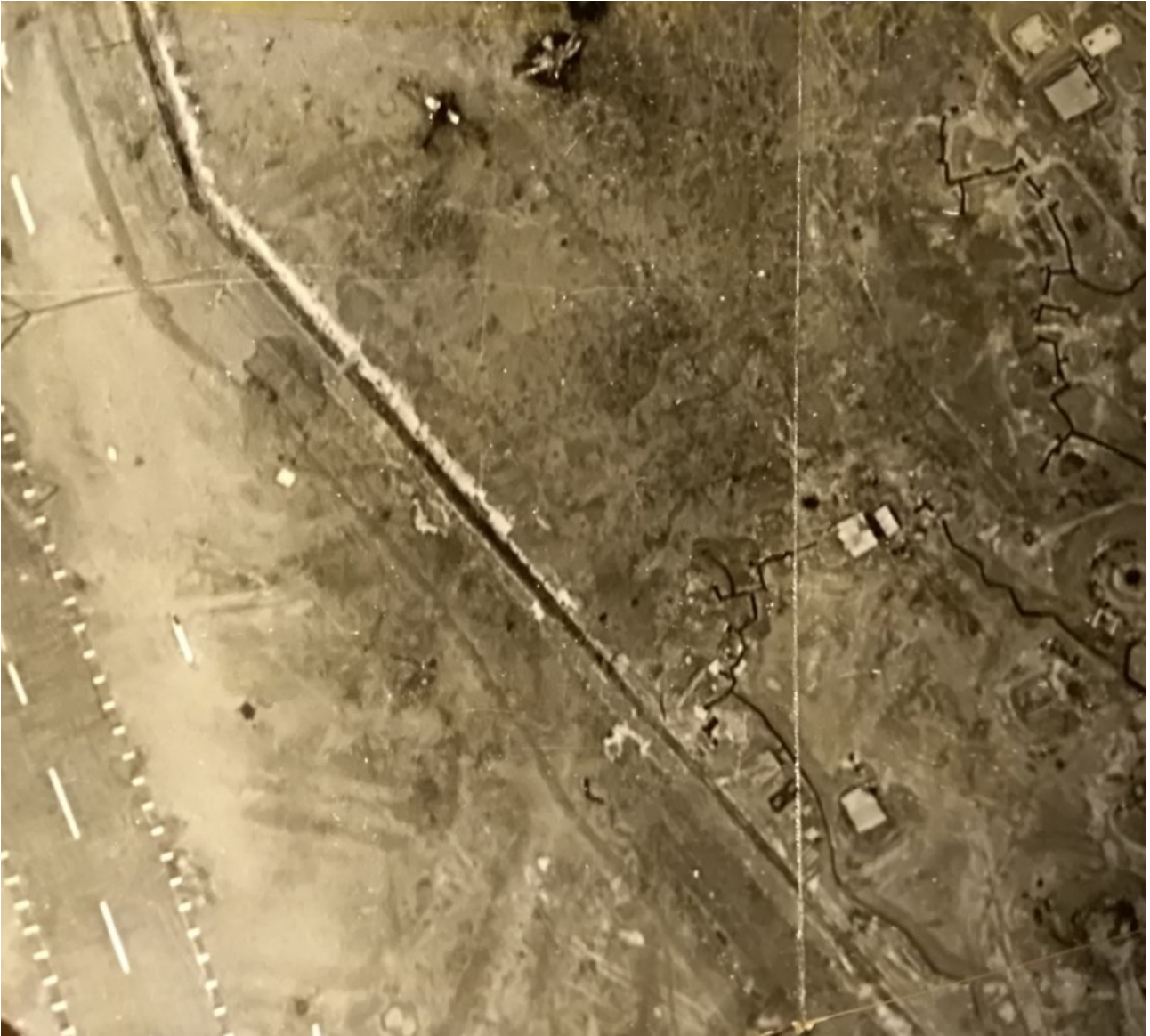
SHD Air : le bord de piste, en haut 2 Criquet détruits.