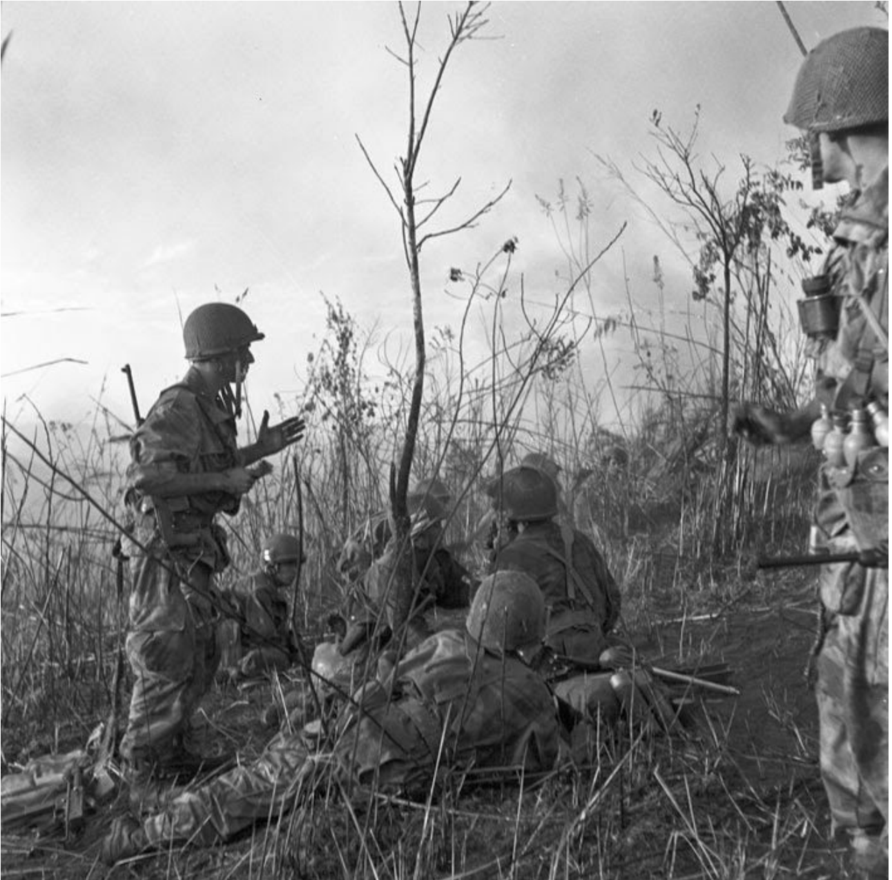
ECPAD : reconnaissance au nord.