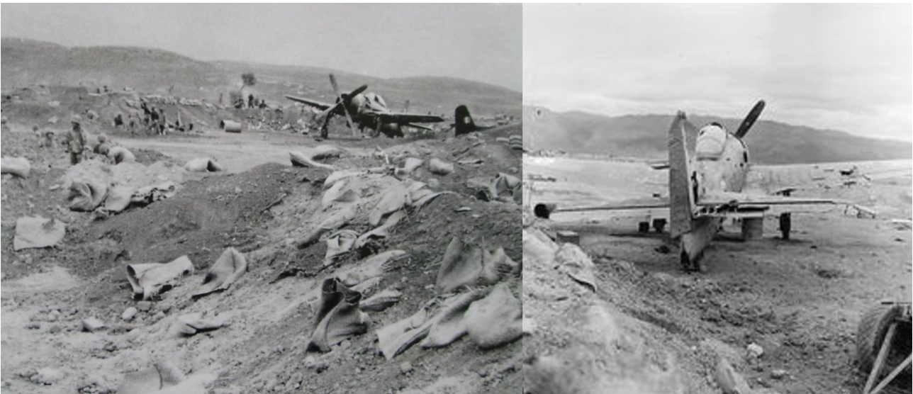
SHD : un Bearcat touché dans son alvéole.

Création de DOMINIQUE 4 au nord-est du 8 e Choc, dans une boucle de la Nam Youn par le capitaine SALINS.