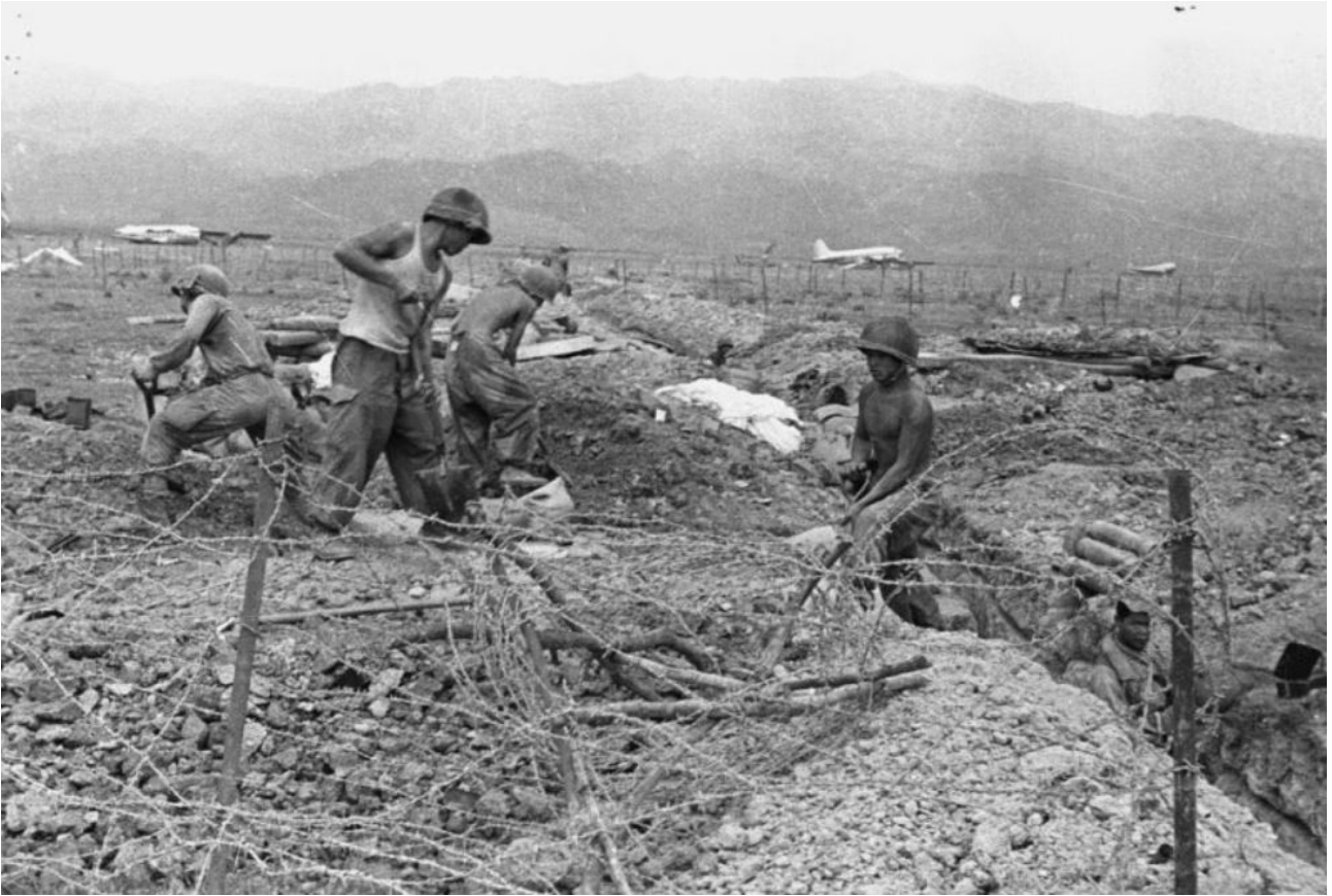
SHD : les soldats creusent une tranchée ; en arrière plan, les carcasses des avions détruits sur la piste.

Du 3/13 e DBLE, il reste en plus la section de garde du GONO et le peloton d'élèves gradés sur le CR central et le service auto.