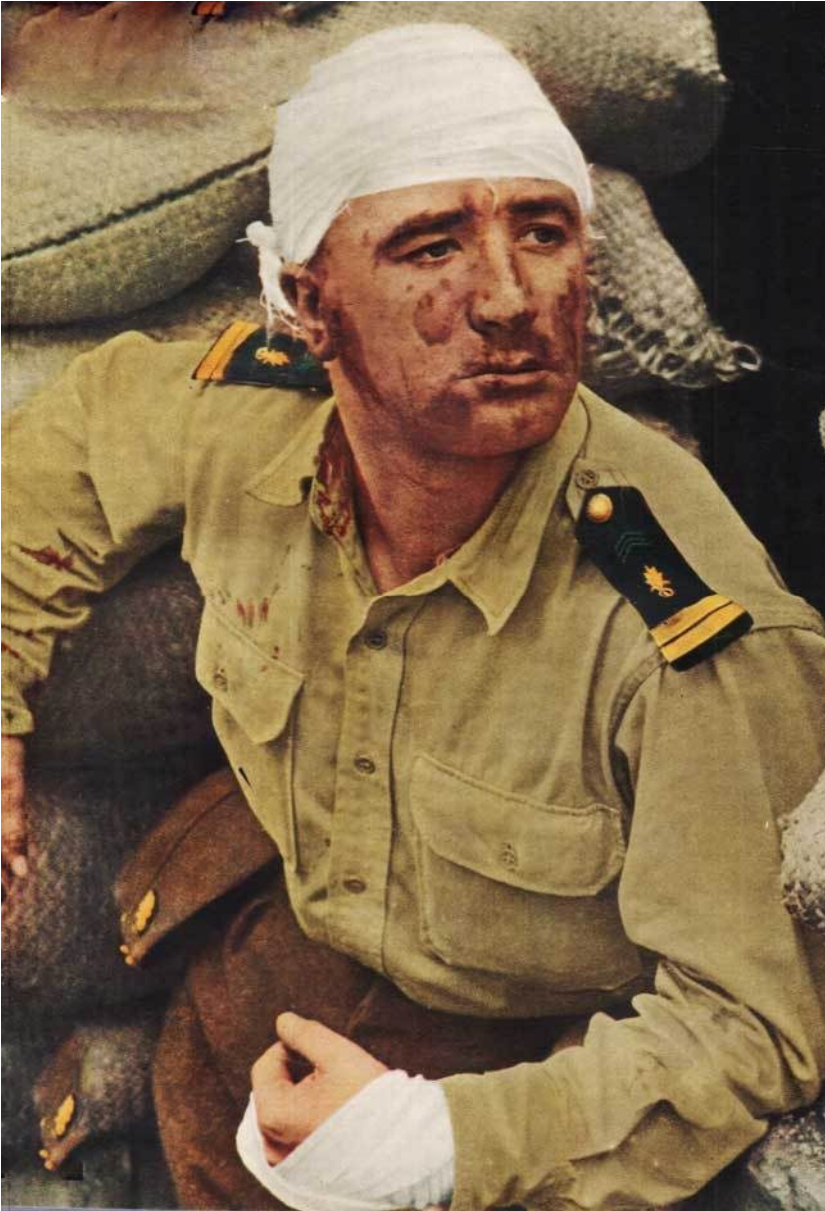
GC 1/22 Saintonge.