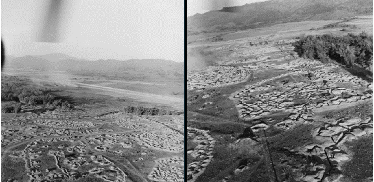
SHD : Détail ISABELLE.

Six Dakota et un premier Bristol sont posés à Diên Biên Phu.