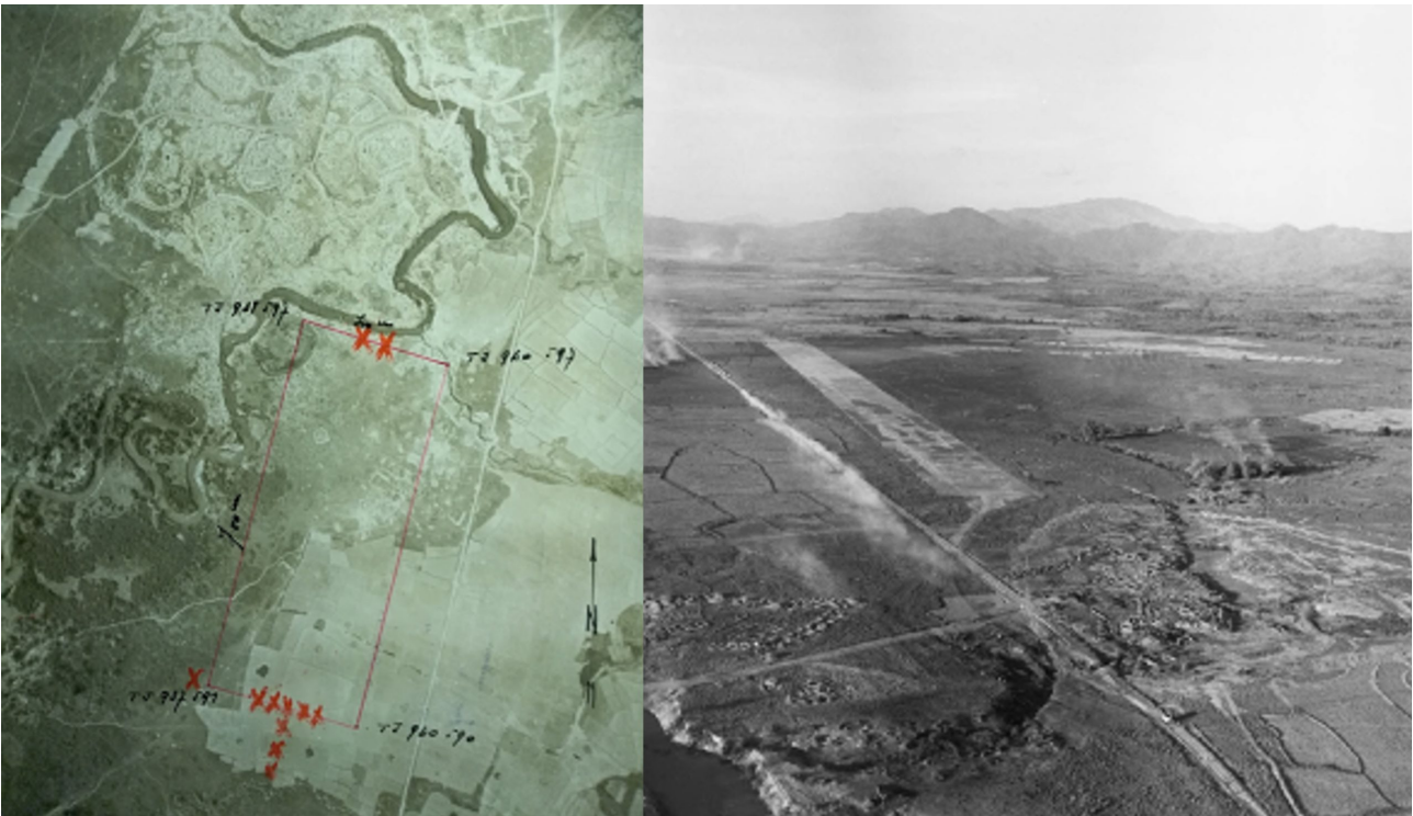
DZ ISABELLE (SHD). Piste et ISABELLE 5 (SHD)..

Selon le chef de bataillon SUDRAT, cela suffit seulement à satisfaire la demande du sous-secteur centre du camp retranché, le centre de transmission et le service de radiographie de l'hôpital souterrain. Le reste des positions et les autres centres de résistance doivent se débrouiller pour trouver du matériel sur place.