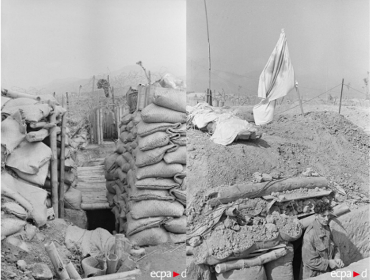
Les protections - entrée de l'ACP.