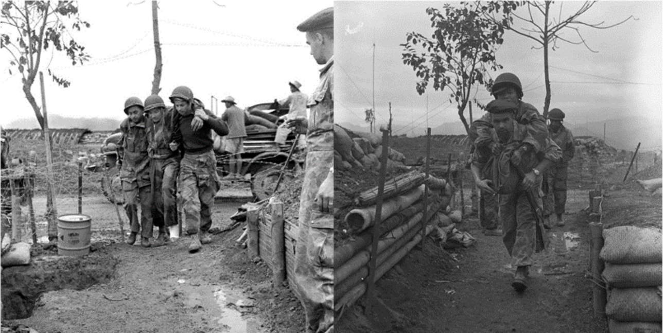
SHD : arrivée des blessés à l'hôpital, en arrière-plan le PC GONO.