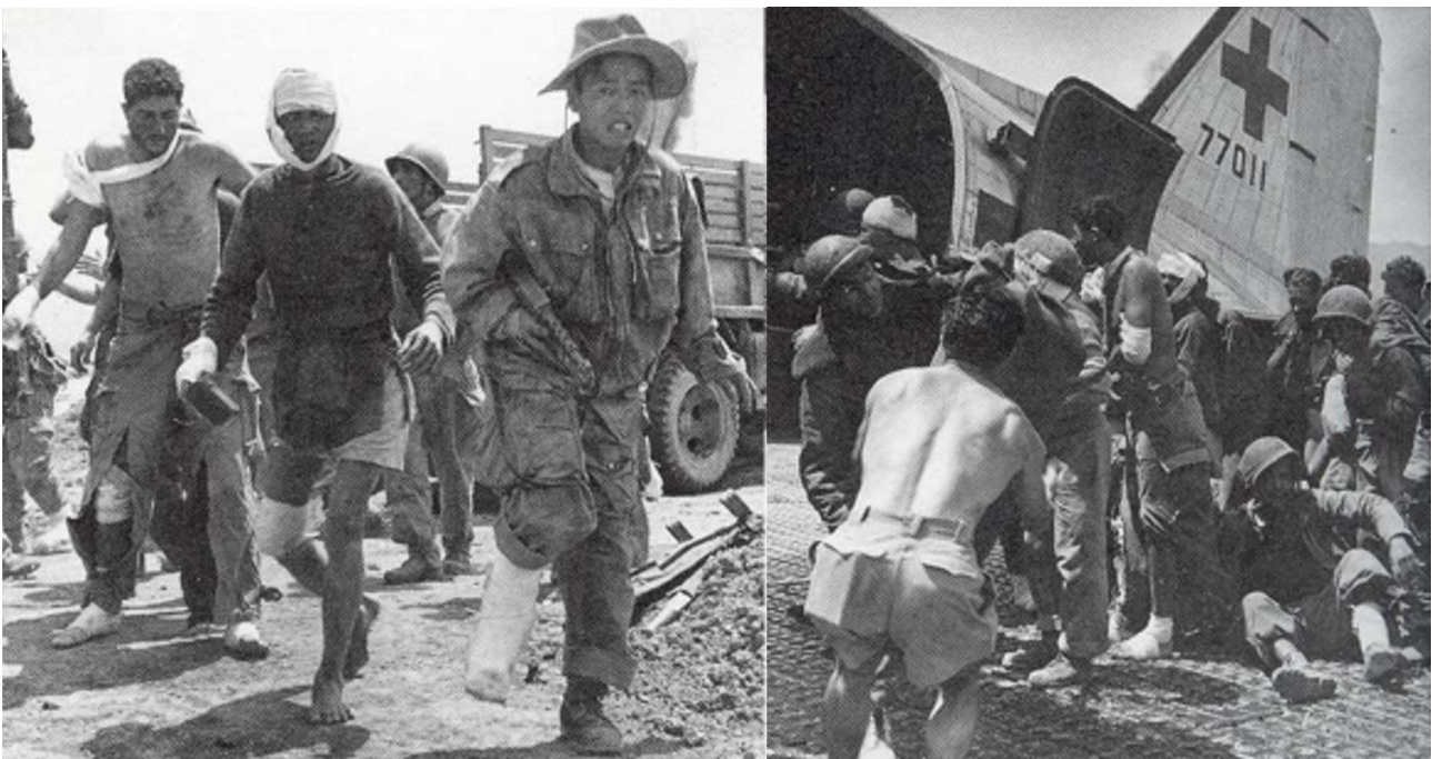
Arrivée des blessés et embarquement.

Le 8 e BPC a 1 tué et 3 blessés dans la journée.