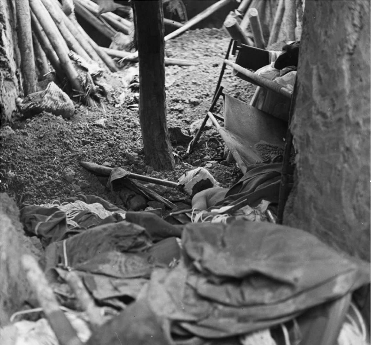
SHD : Destructions dans l'hôpital.

Compte tenu du relief et de la météo dans la région on peut espérer effectuer par jour deux rotations et au maximum trois dans des conditions extrêmement favorables.