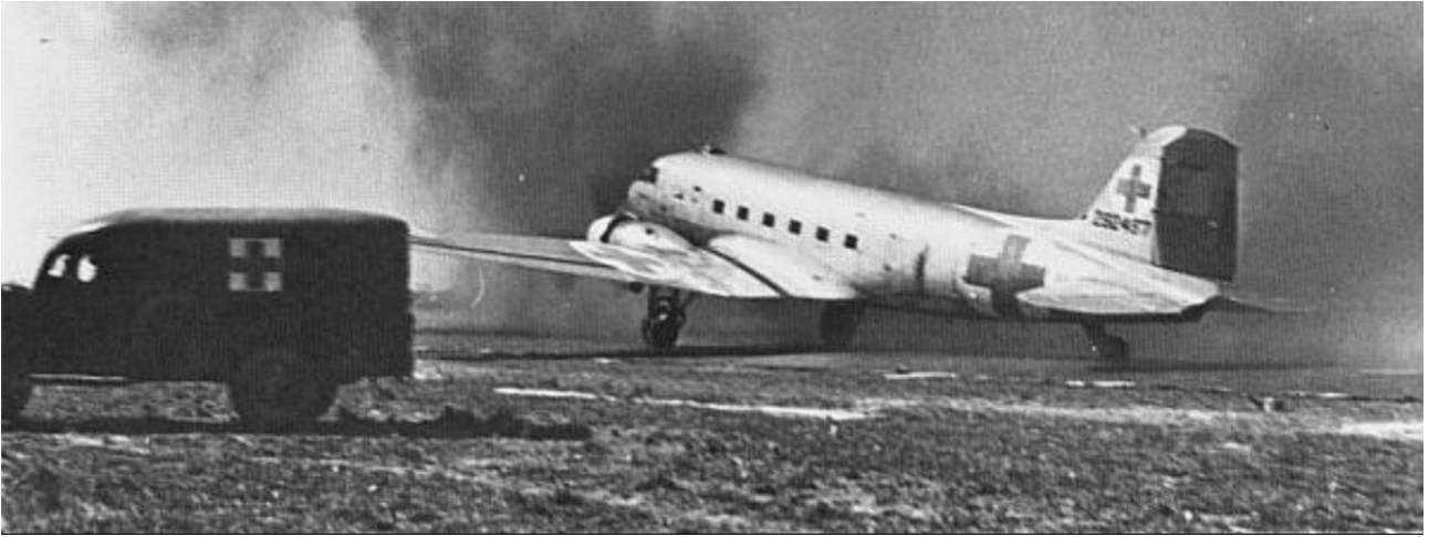
SHD : Explosion devant un avion d'évacuation.