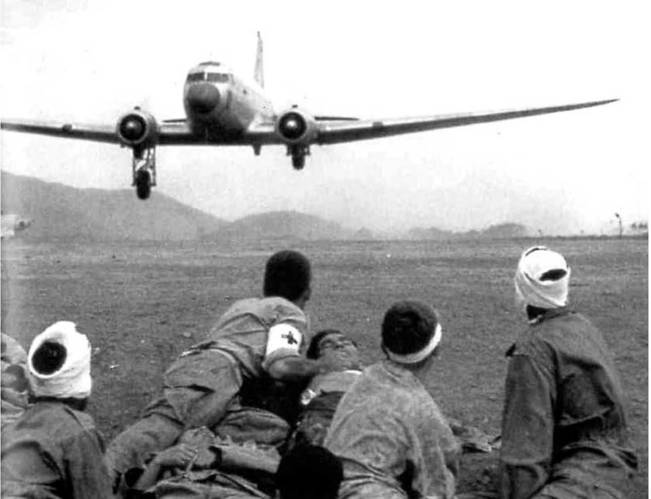
SHD : Attente avant l'évacuation.