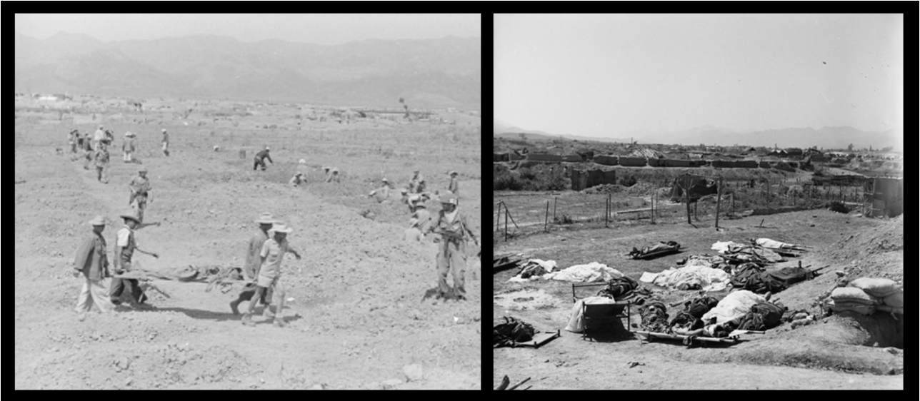
SHD - Photo de gauche : le cimetière de l'hôpital. Photo de droite : la morgue de l'hôpital.