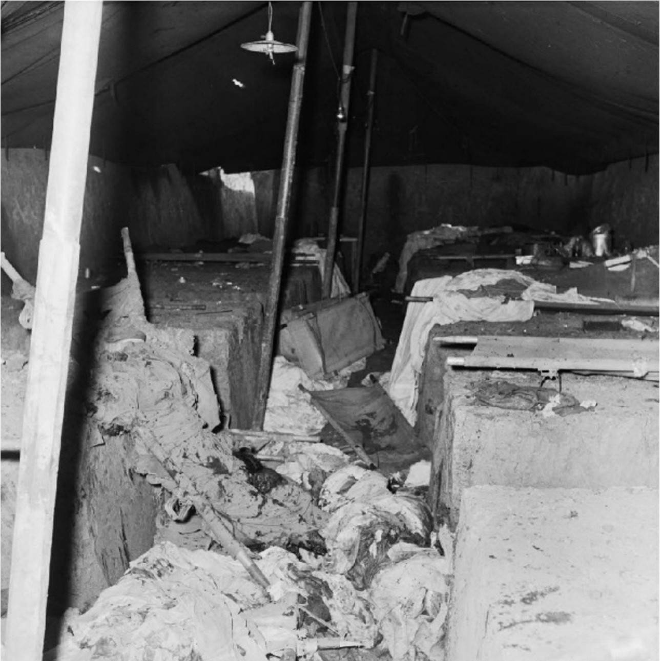
Salle de triage après l'explosion d'un mortier de 120 mm.