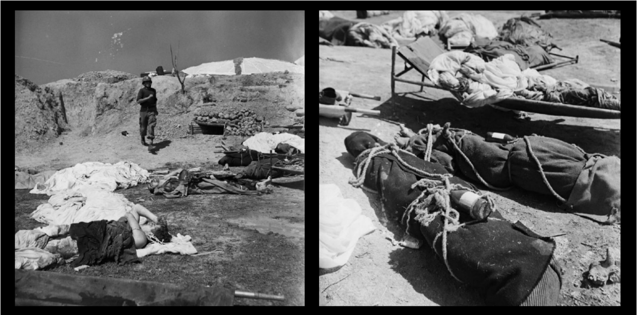
SHD : la morgue de l'hôpital.