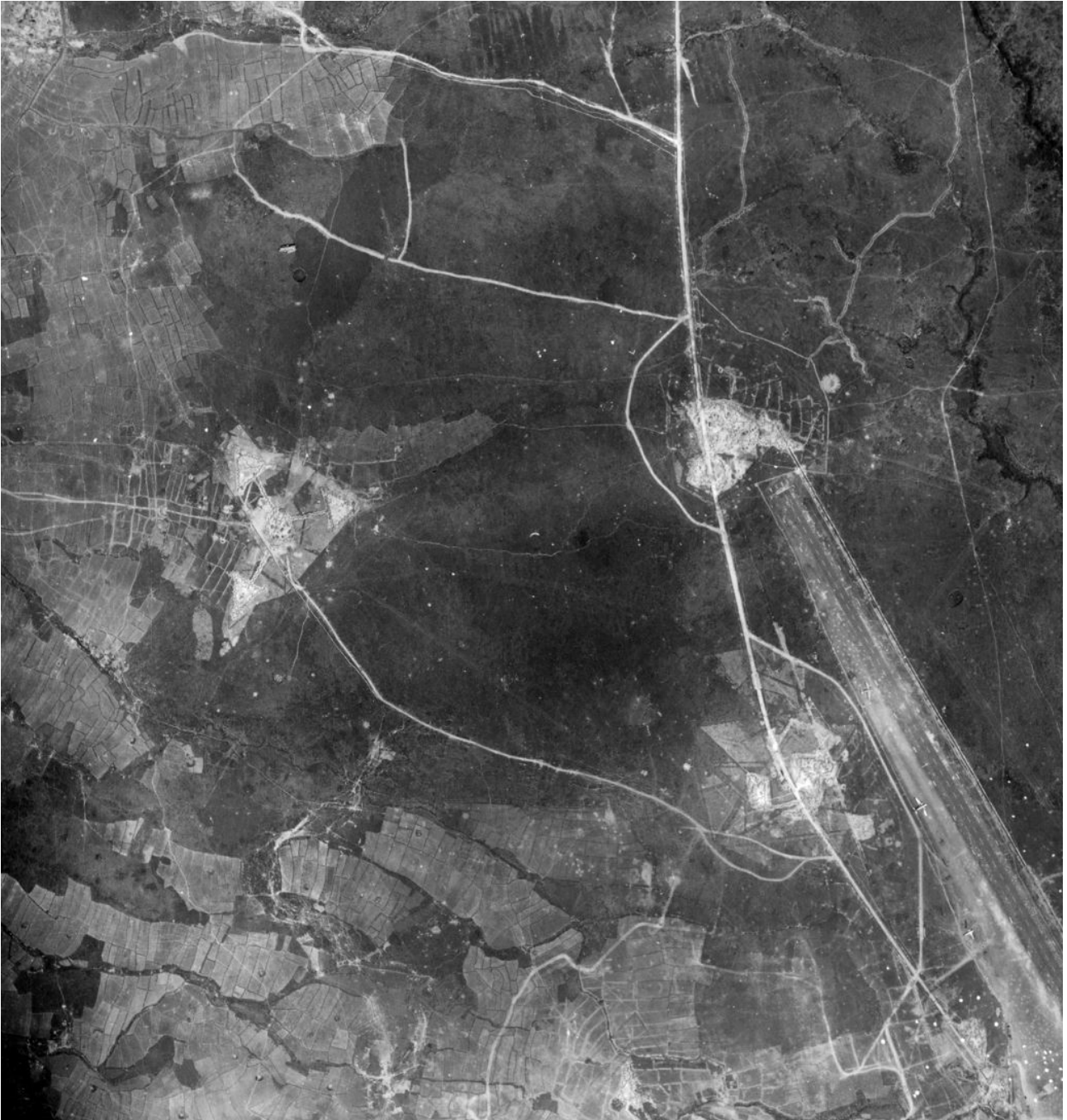
SHD AIR : Huguette 6 et 7.

Tir de DCA de 37 mm sur avion en provenance de l'Est de la cuvette à 12 500 pieds.