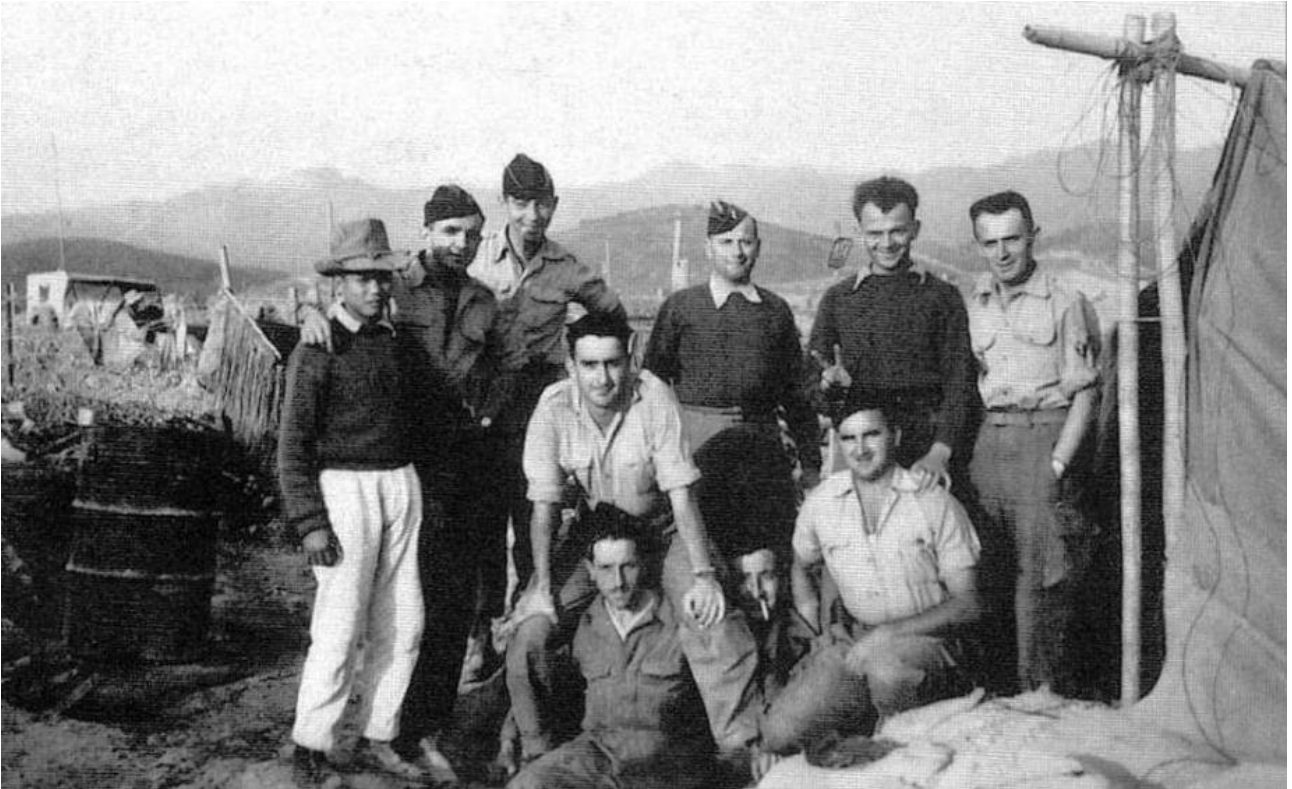
Gendarmes à Diên Biên Phu.