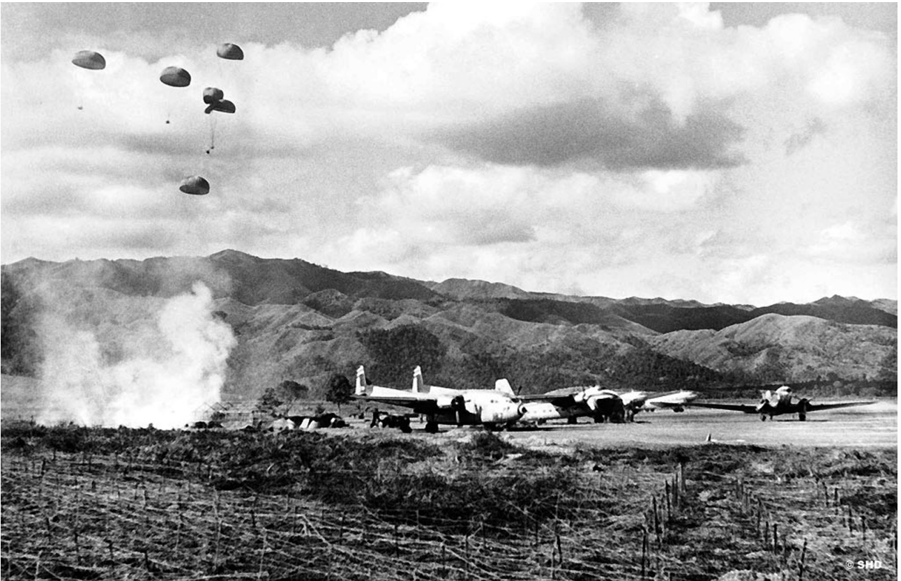
Parachutage de ravitaillement sur un point d'appui à Diên-Biên-Phu, en février 1954. Au sol, un des Fairchild C-119 Packet envoyés par les États-Unis, un Bristol 170 Freighter et trois Douglas Dakota.

Opération USAF Ironage V jusqu'au 14 mars au début 4 C-119 à 12 C-119 pour larguer du barbelé et des pieux à Luang Prabang et du barbelé et des munitions à Diên Biên Phu.