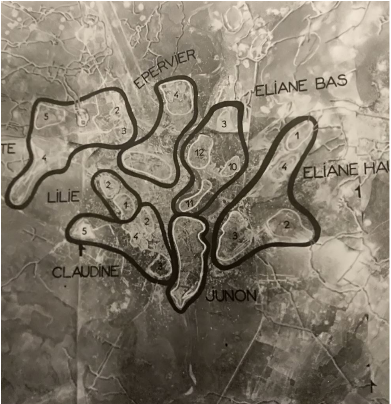
SHD : Situation le 1er mai 1954.