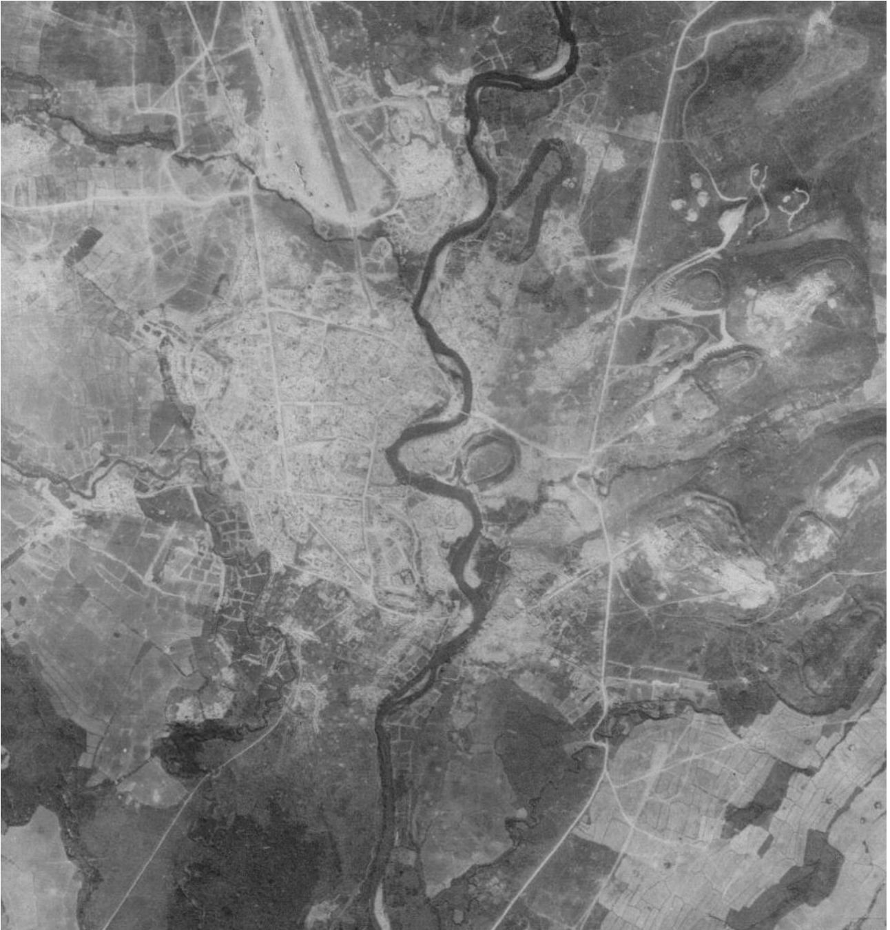
SHD : photographie aérienne.