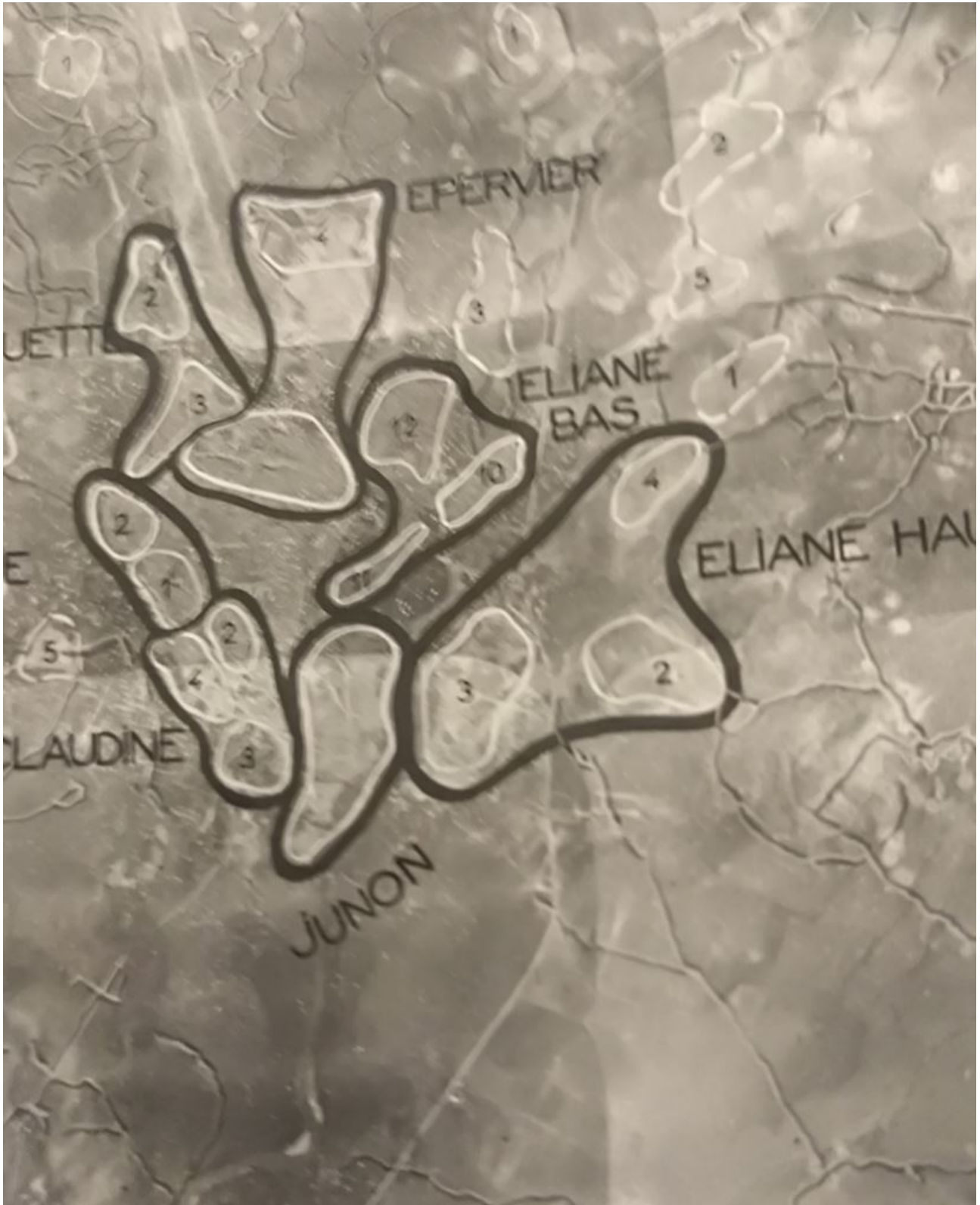
photographie aérienne situation du 02 mai 54.