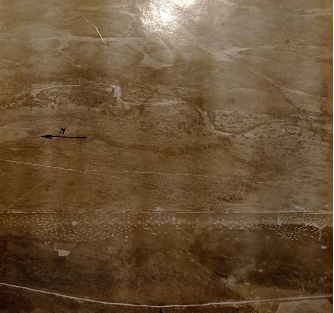
SHD : Sabotage sur la piste.

Jusqu'au 3 décembre effectués des travaux de protection et de mise en état du terrain d'aviation par la C ie du génie renforcée par une main d'œuvre prélevée sur les unités parachutistes. Le terrain avait été rendu inutilisable par le Vietminh en le parsemant de trous de loup.