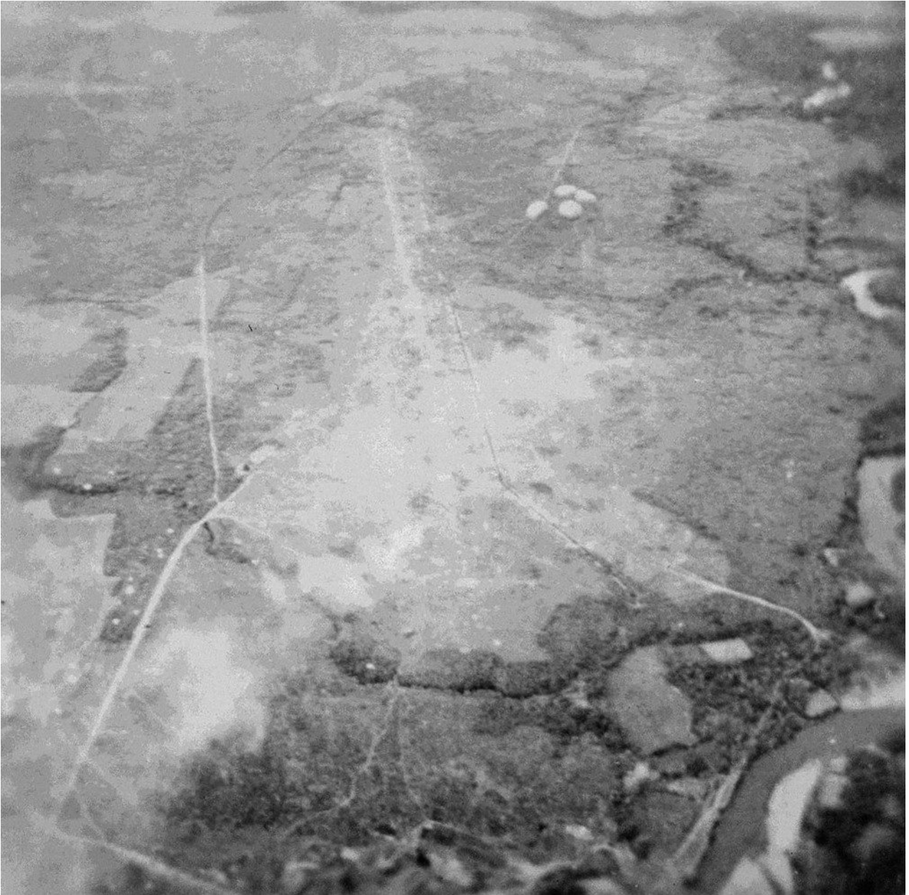
SHD Air : parachutage lourd sur la piste.