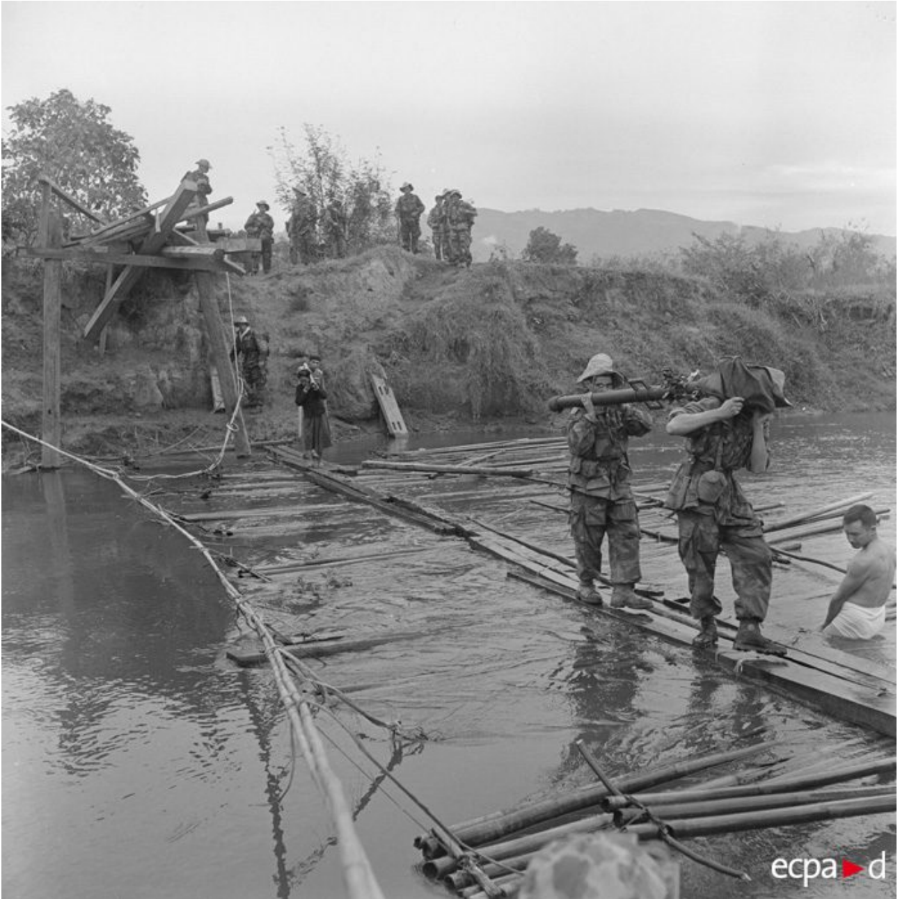
Déplacement d'un canon de 75 sans recul.