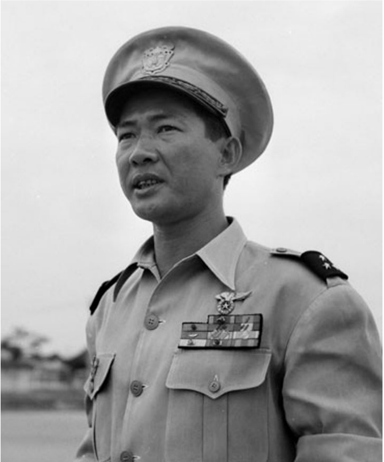
Général Nguyen Van Hinh (1915-2004), chef d'état major de l'Armée nationale vietnamienne, armée de l'État du Viêt Nam de 1952 à 1954.