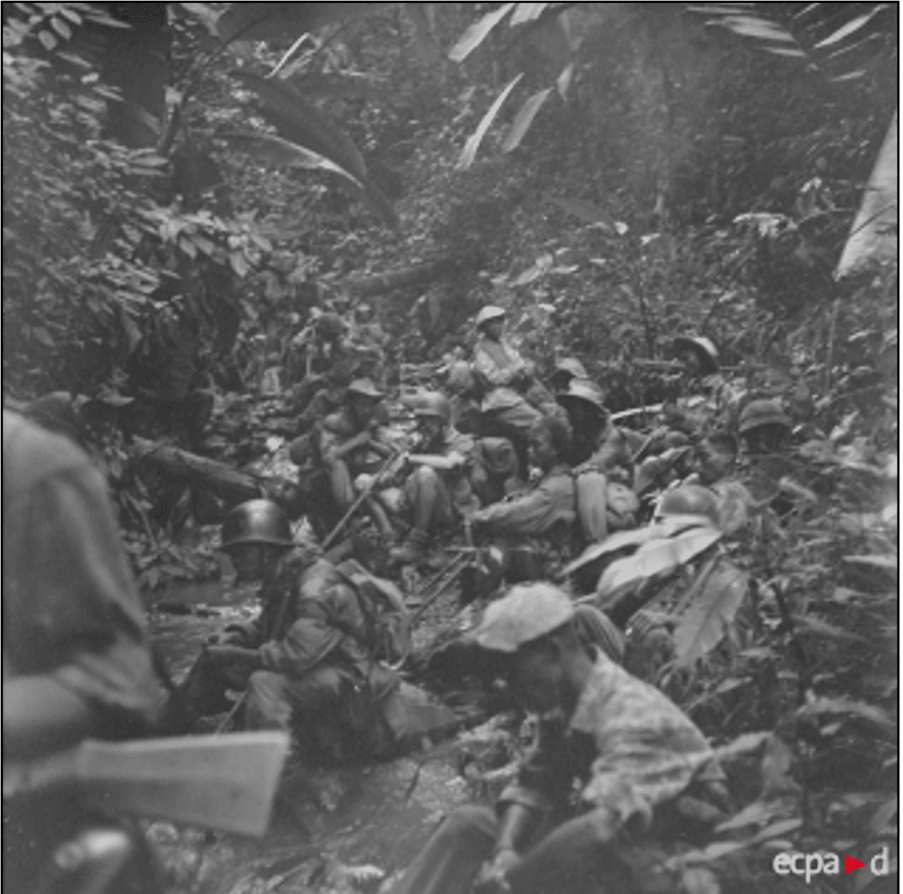
Liaison Sop Nao - Régate. Des parachutistes de la colonne LANGLAIS font une halte au bord d'un ruisseau en plein jungle, au cours de leur progression vers le Laos.