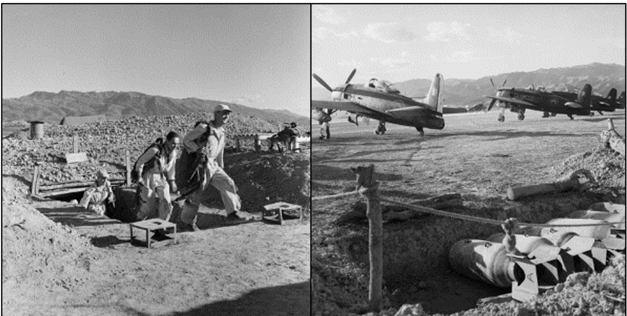
L'abri des pilotes, les Bearcat et les soutes à bombes au sud-sst de la piste.

3 Privateer de la 28 F détachés à Cat Bi depuis le 21 septembre sont mis en alerte pour 4 sorties de jour et 2 sorties de nuit pour l'interdiction des voies de communication alimentant Dien Bien Phu au profit du GATAC.