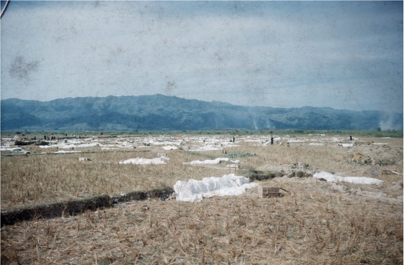
ECPAD : Parachutes sur la DZ Natacha.