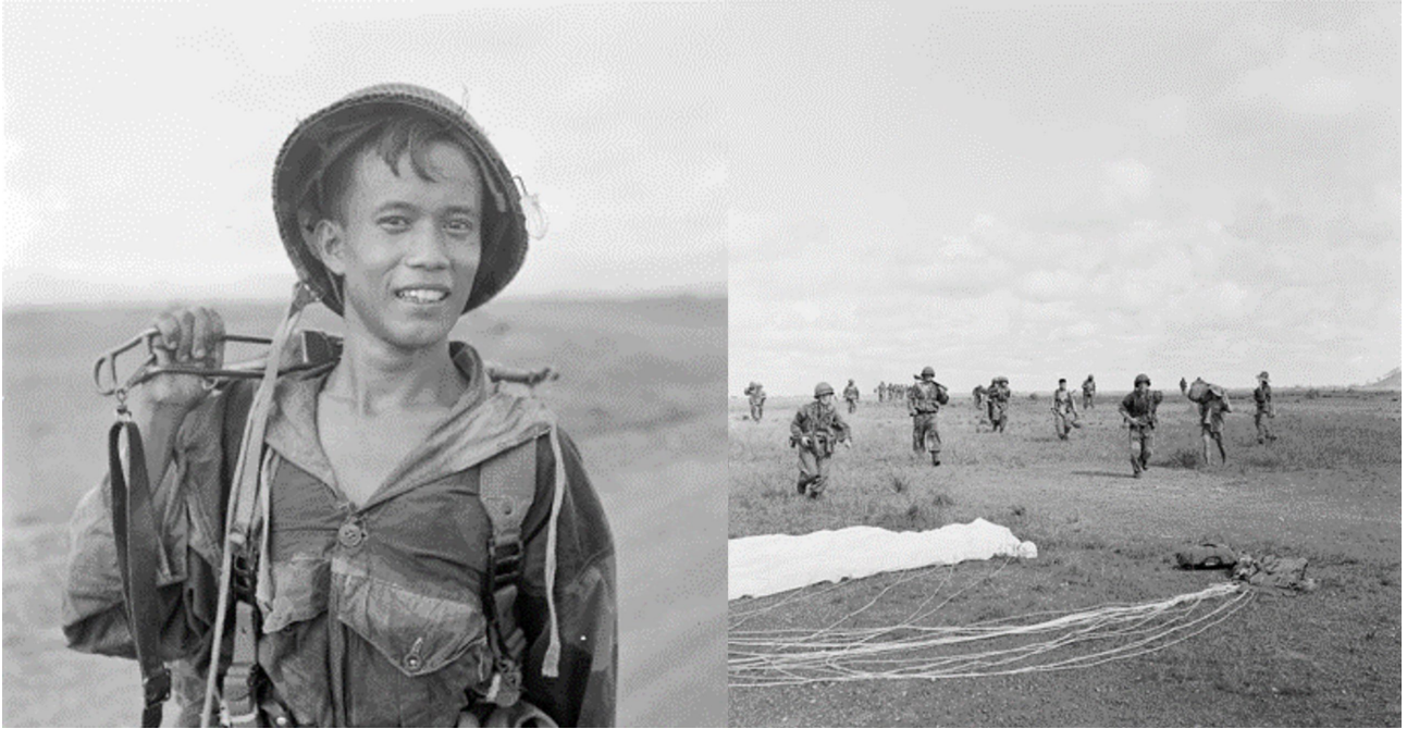
parachutistes vietnamiens.

qui, malgré le qualificatif prometteur d'offensive, risque de dégénérer rapidement en camp retranché.