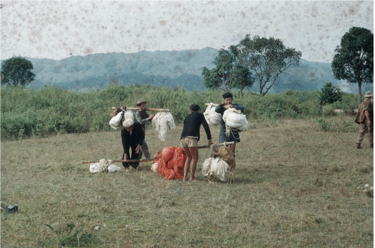
ECPAD : Récupération des parachutes par les villageois Thaï lors de l'opération Castor (novembre-décembre 1953. Crédit : Henri Mauchamp.

Début des reconnaissances et poursuite les 23 et 24. Pas de contacts avec les Viets mais prise de contact avec les partisans thaï venus de Lai Chau.