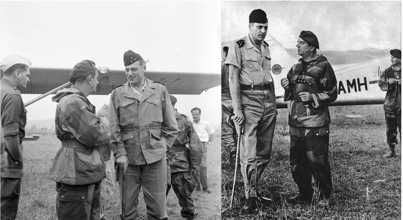
Généraux GILLES et COGNY.