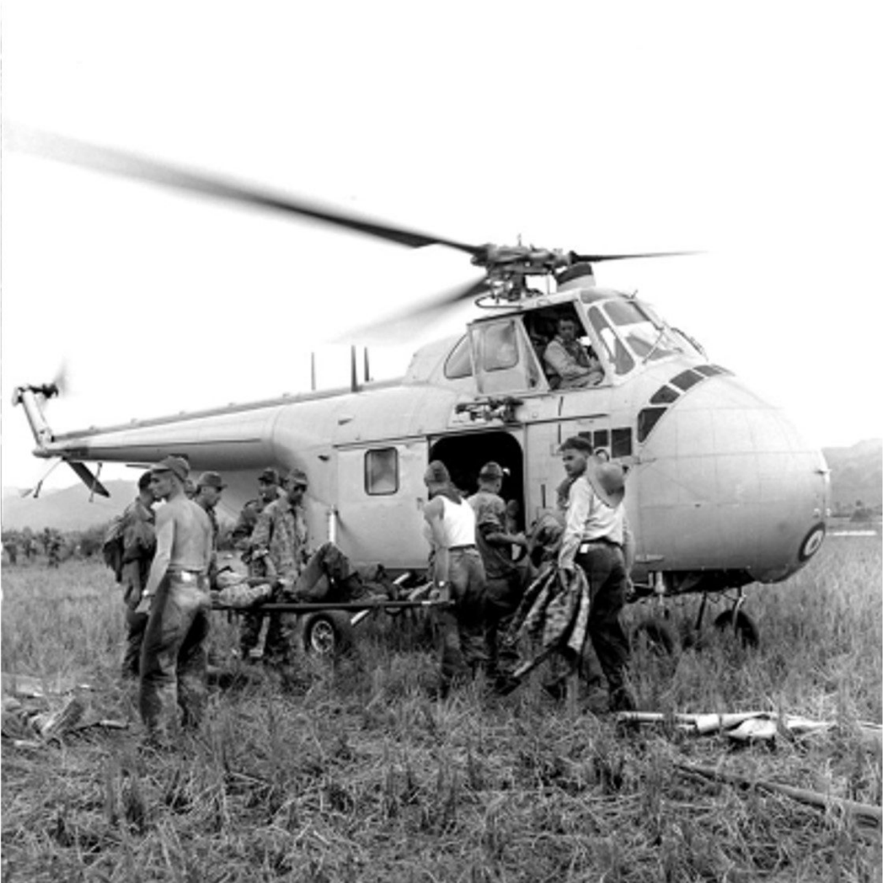
Évacuation sanitaire.