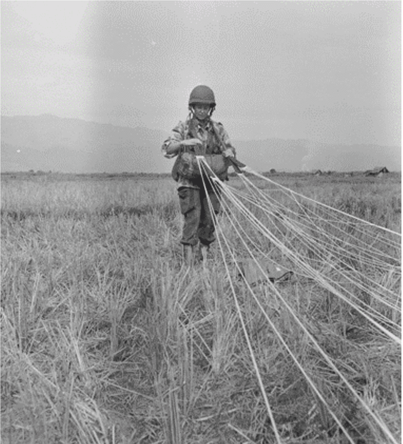
Brigitte Friang parachutée.