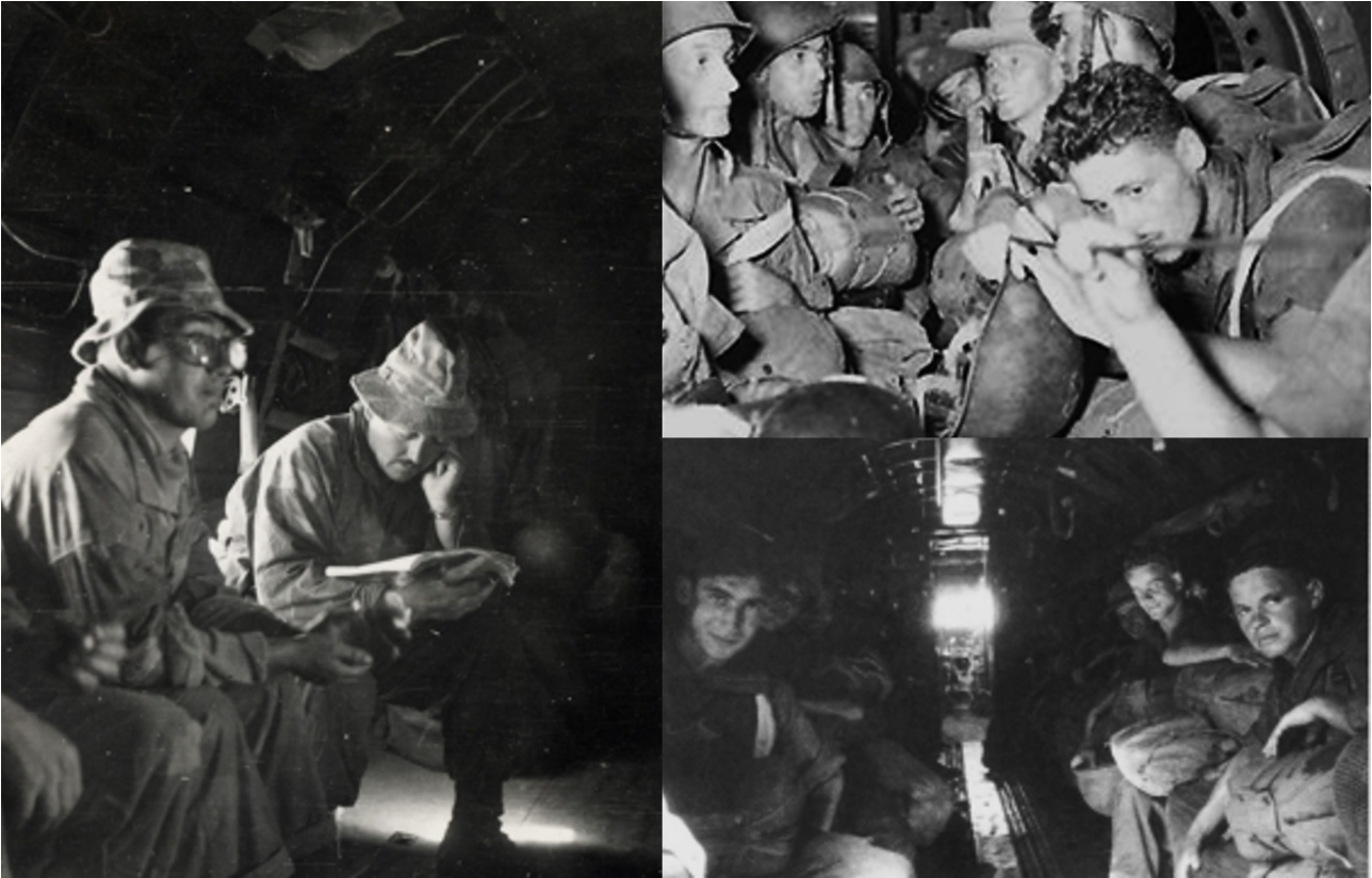
Dans un avion - 22 novembre 1953.