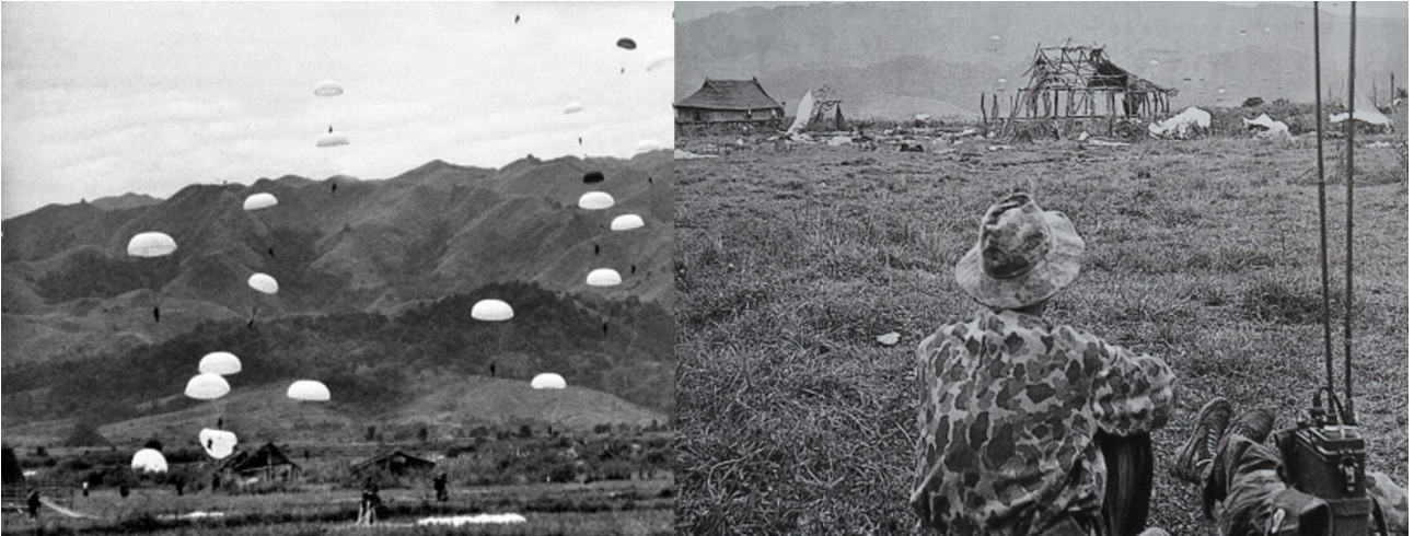
parachutage sur la vallée / des restes du village.