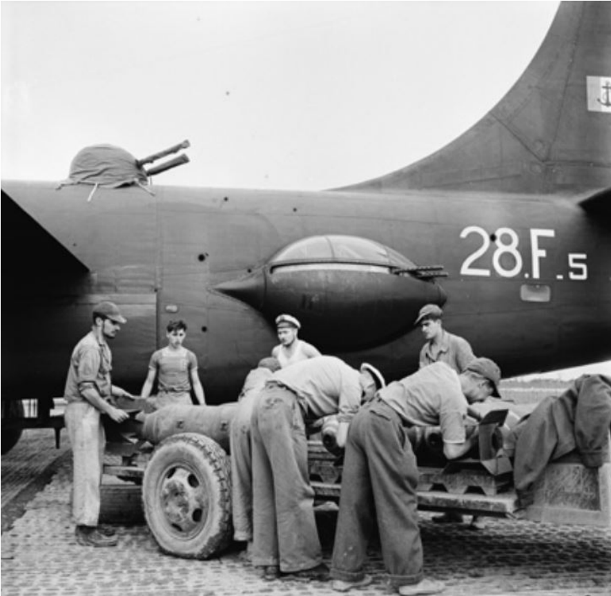
SHD Air : chargement de bombes dans un Privateer.

Bach Mai, 12 Bearcat décollent armés en bombes de 1 000 livres.