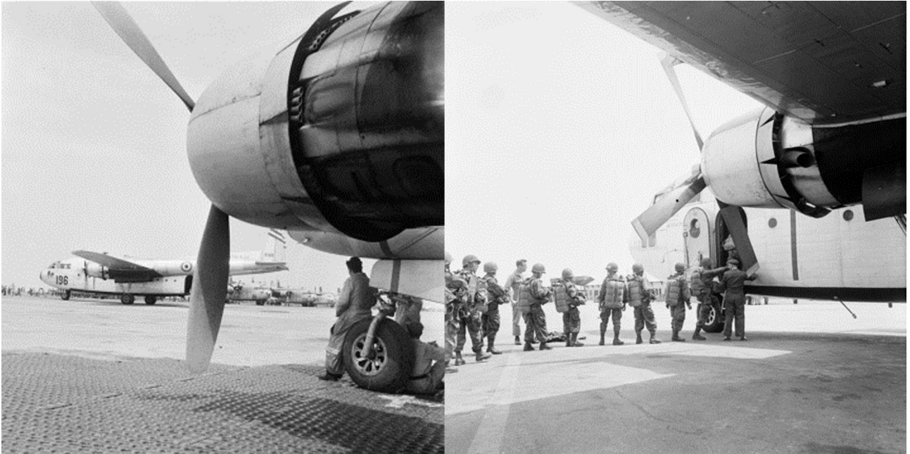
SHD : C-119 sur le parking et embarquement.