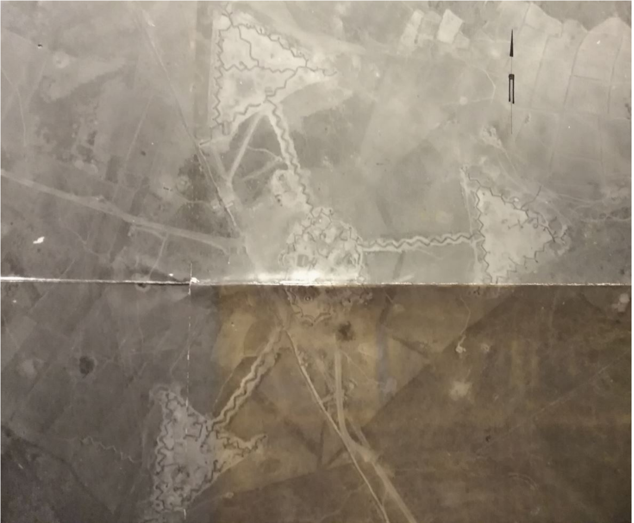
photographie aérienne HUGUETTE 7 anciennement ANNE-MARIE 3.

Les Viets ont pour objectif final, le rush sur la piste d'aviation qui la mènera au cœur du dispositif. Division 312 entame le nord du PA en étoile . Dans la nuit l'ennemi arrive à pénétrer dans l'ouvrage Nord.