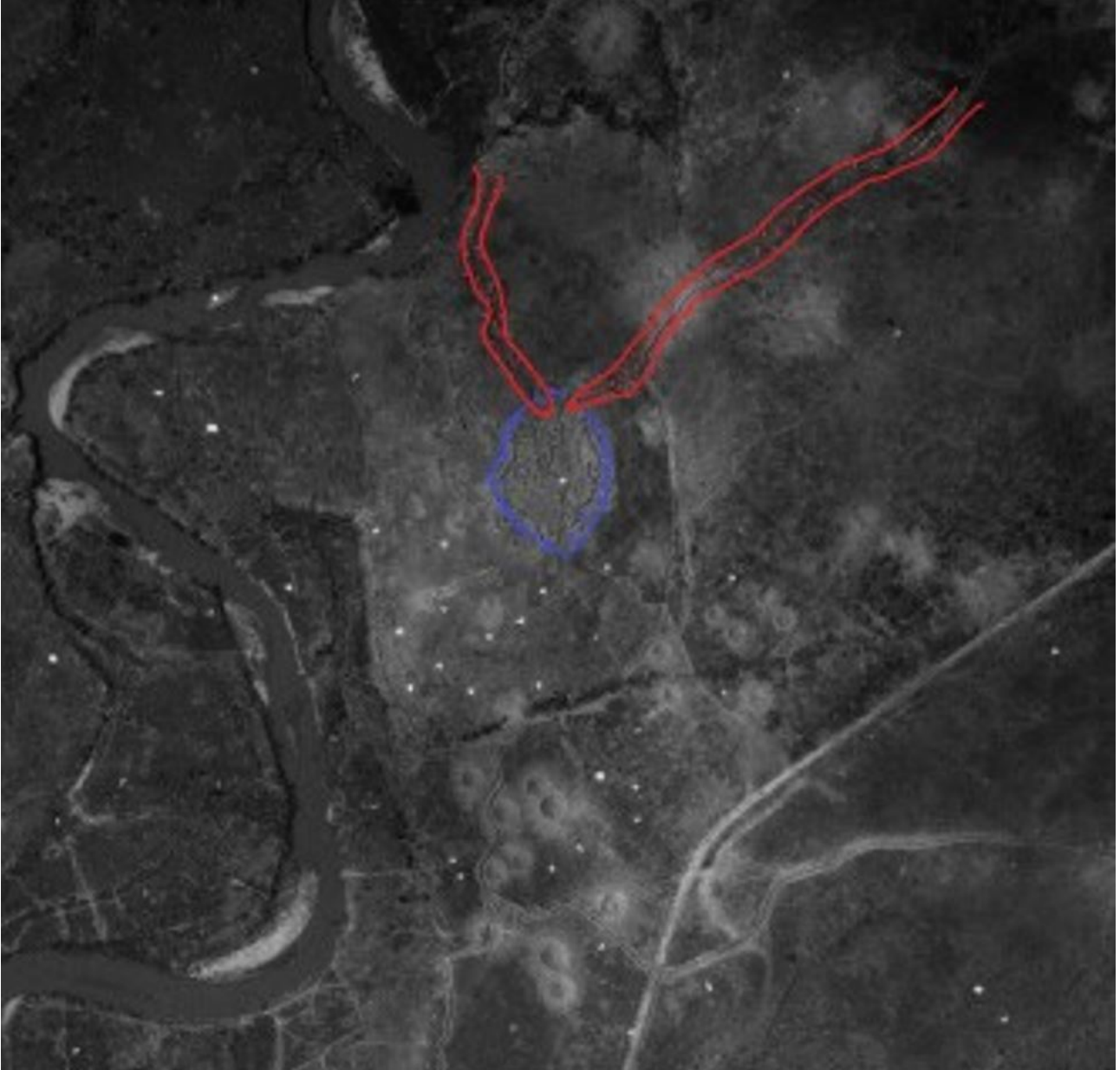
SHD Air : mission HV367 du 06 avril 1954 - Attaque Dominique 1.

Vietminh doit travailler au-dessus du sol et beaucoup sont touchés.