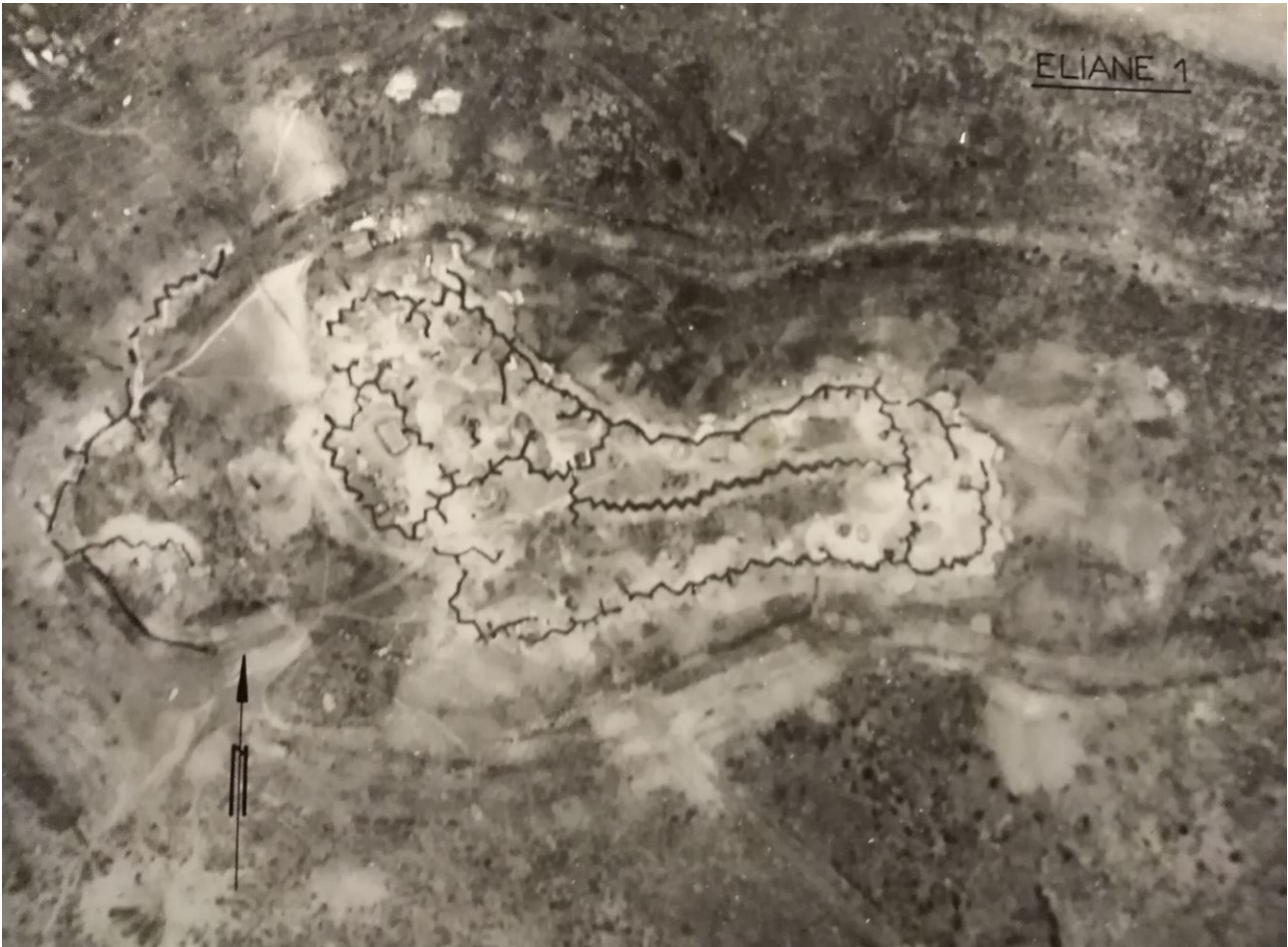
Eliane 1 avant la bataille.