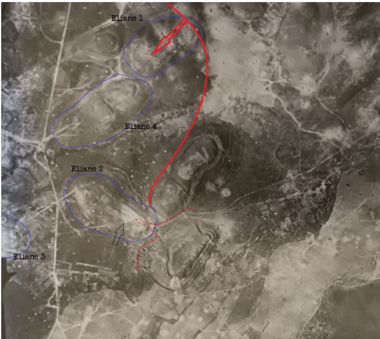
SHD Air : les attaques sur Eliane 2 et Eliane 1.