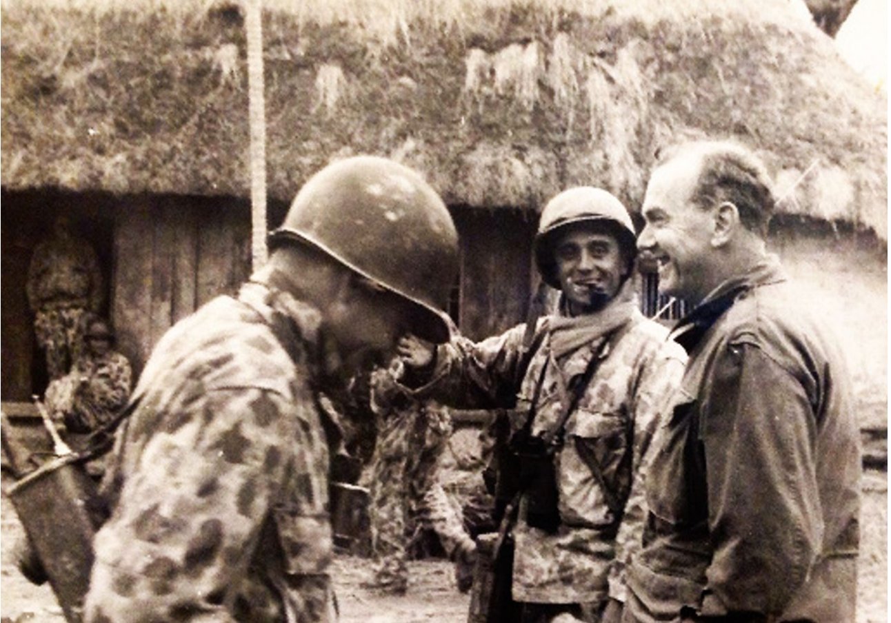
Graham Greene en Indochine, avec des soldats français, décembre 1951.