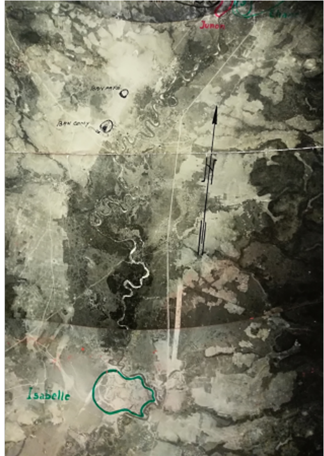
photo aérienne de la situation au 5 mai 1954.