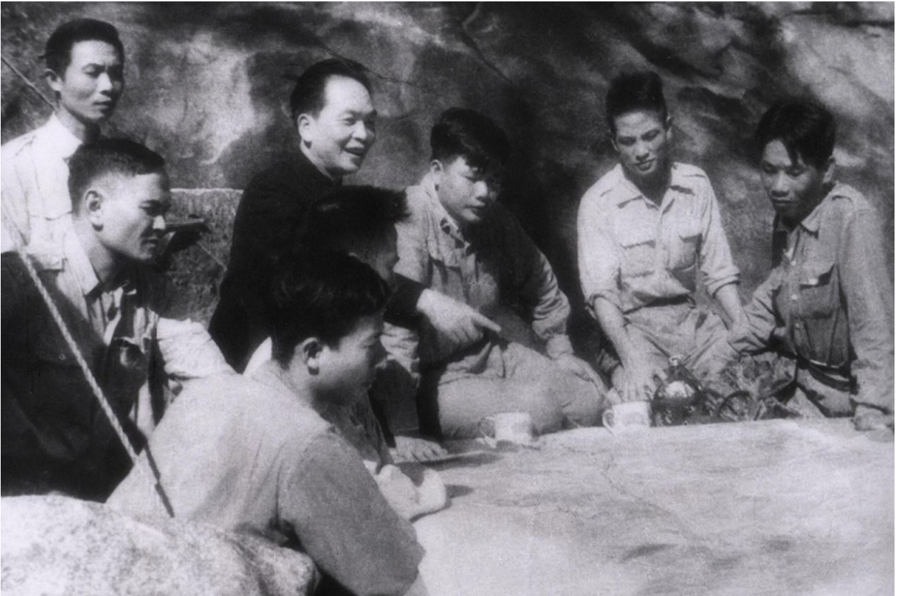
GIAP et son état-major.

La sortie Albatros semble possible et la moins mauvaise solution. L'observation aérienne, les dernières photos de l'EROM 80, larguées sur le PC GONO, montrent une seule tranchée viet en travers de l'itinéraire sud.