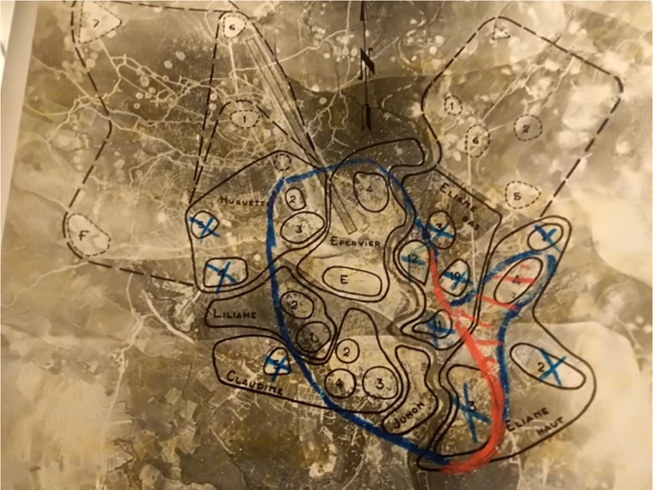
photographie aérienne de la situation au 6 mai 1954.