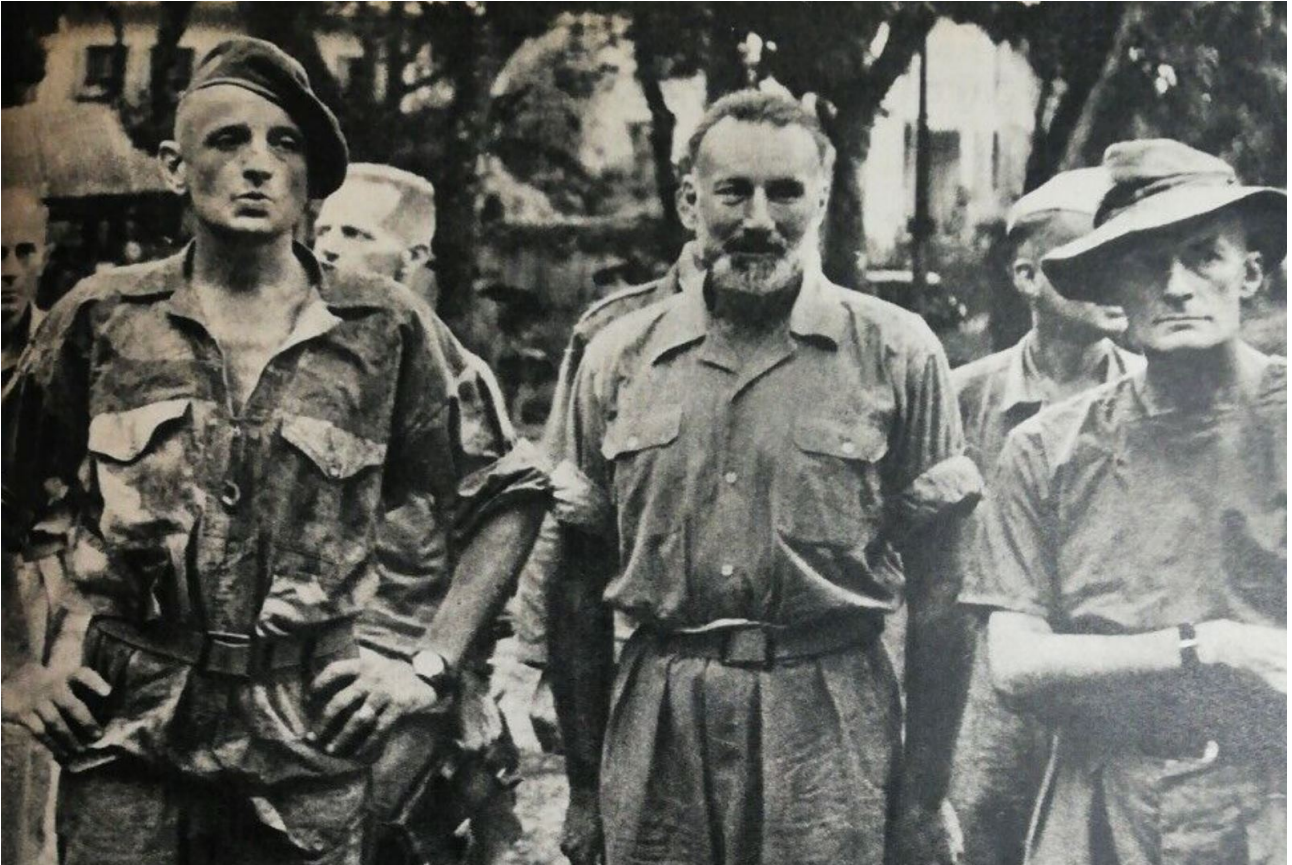
De gauche à droite : Bigeard, l'aumônier Heinrich et Langlais.

La question des sépultures des morts de la guerre d'Indochine (Revue Historique des Armées - 2016)