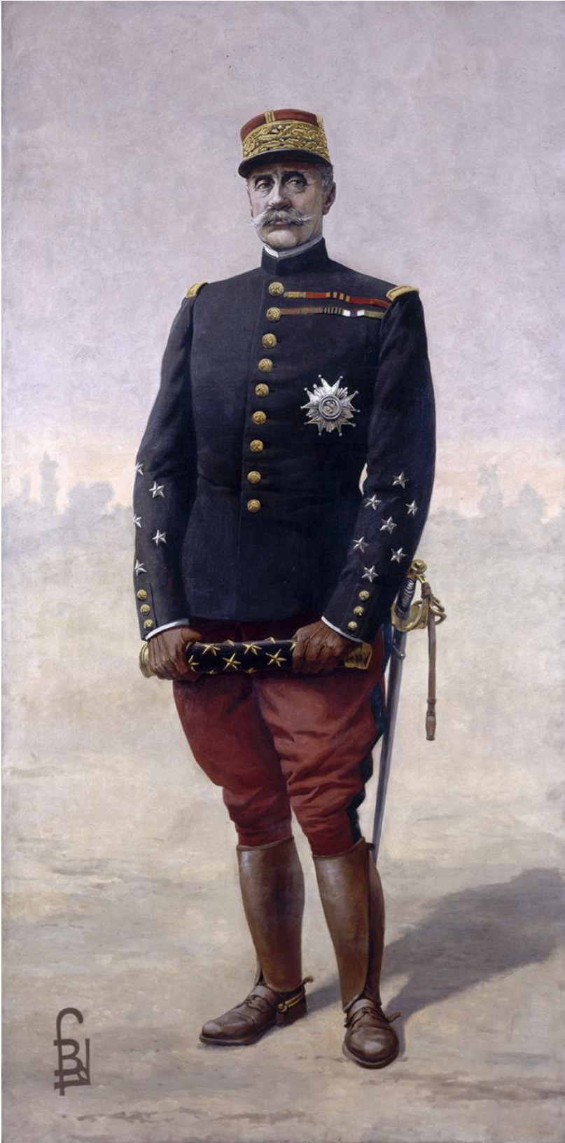
Lorsqu'en mai 1917, Pétain