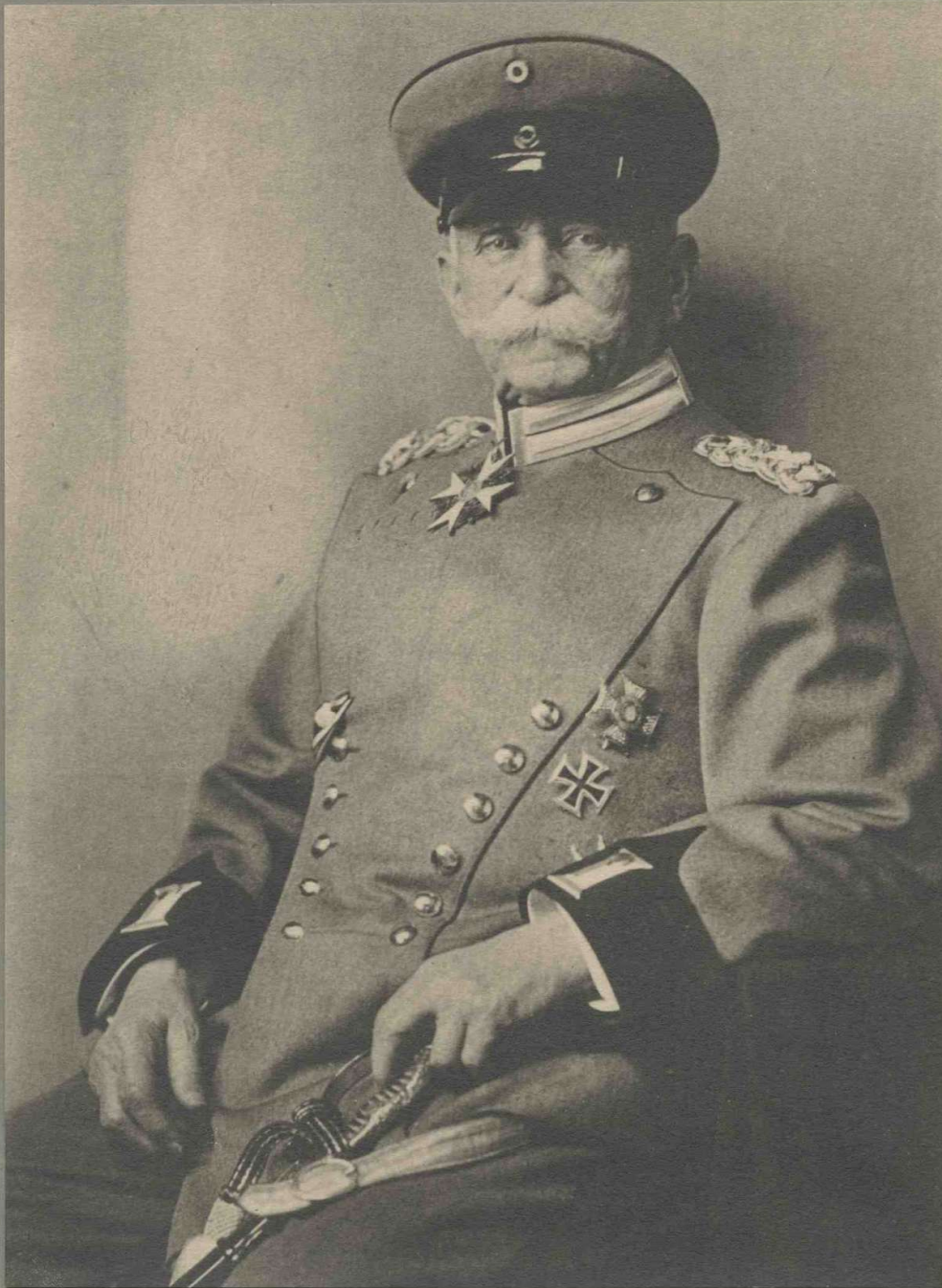
Graf Ferdinand von Zeppelin