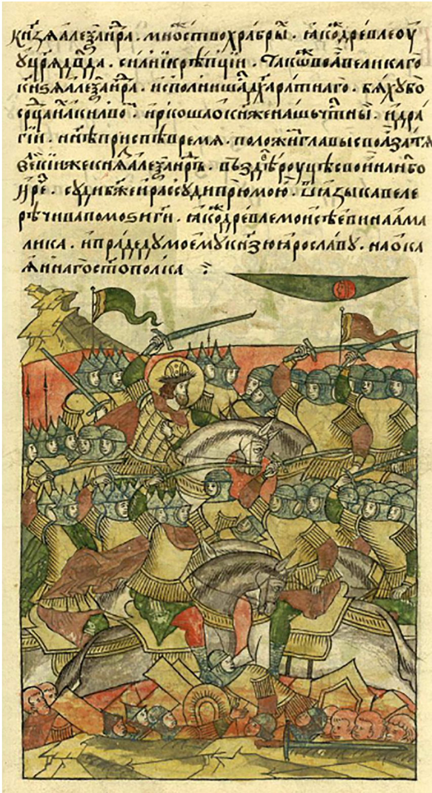
Avec le soutien du pape et de l'empereur du Saint-Empire romain germanique, les chevaliers teutoniques tentent d'étendre