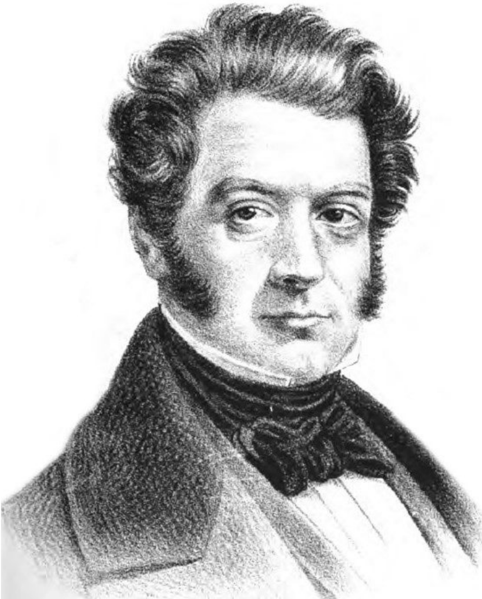
Jorge Beauchef (1785 ou 1787 - 1840).

En 1817, le général argentin José de San Martín traverse les Andes à la tête de son armée, triomphe des Espagnols lors de la bataille de Chacabuco et entre dans Santiago du Chili. Le vice-roi du Pérou envoie alors une armée commandée par le général Mariano Osorio, qui bat celle de San Martín lors de ce que les Chiliens appellent encore le « désastre de Cancha Rayada », le 19 mars 1818, l'avant-garde de Bernardo O'Higgins étant totalement prise au dépourvu et le général chilien étant lui-même grièvement blessé au bras lors de cette bataille. Cette victoire espagnole est néanmoins incomplète et les troupes de San Martín se rassemblent à nouveau.