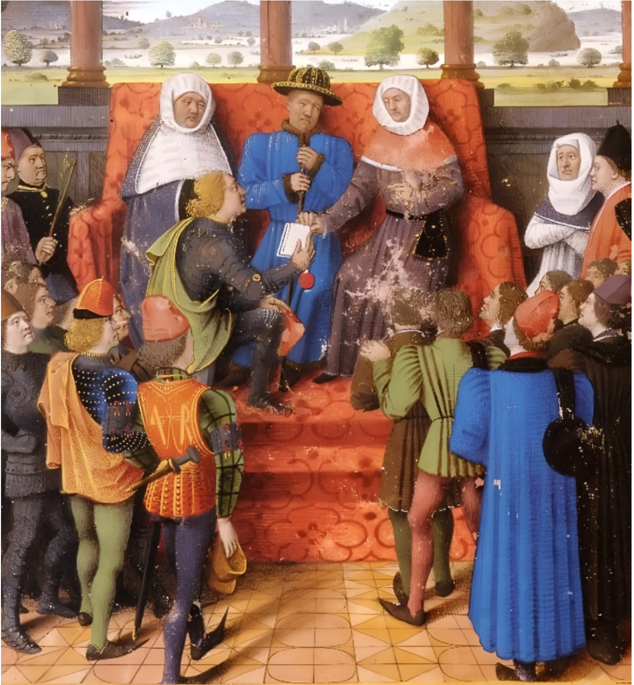
Le Jouvencel fait lieutenant par le Roi.