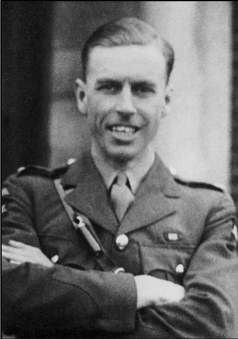
Terence Brandam Hastings OTWAY (1914-2006).

Terence Otway , perfectionniste à la poigne de fer n'était pas homme à rechercher la popularité. En revanche, il inspirait le respect à ses subordonnés comme aux officiers de son rang. Comme le général Hill, Otway était le type même du chef parachutiste solide, énergique, capable de déchaîner sa fougue et celle des autres, refusant d'admettre la défaite jusqu'à ce qu'il ait subi l'estocade finale. Il reçut ses ordres le 2 avril 1944, ce qui ne lui laissait que deux mois pour organiser et répéter l'attaque. D'après ce qu'on en savait, la batterie de Merville