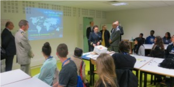
Visite du ministre de la défense dans une salle du Fort Neuf de Vincennes.