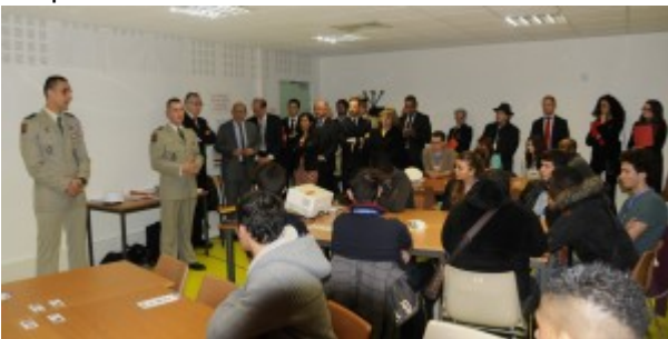
Le ministre de la défense assiste à la présentation de la Légion étrangère faite par un lieutenant et un caporal d'origine argentine.