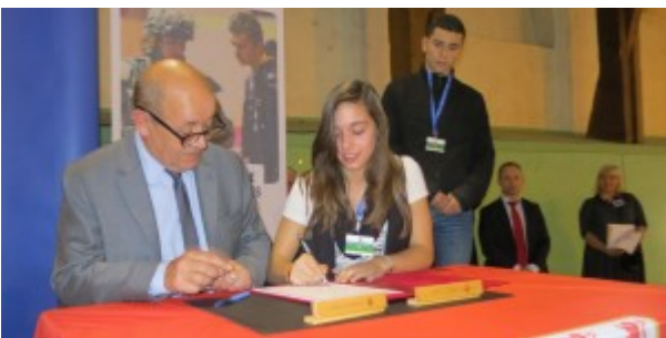
Jean-Yves Le Drian signe le diplôme d'une jeune élève assistant à la JDC.