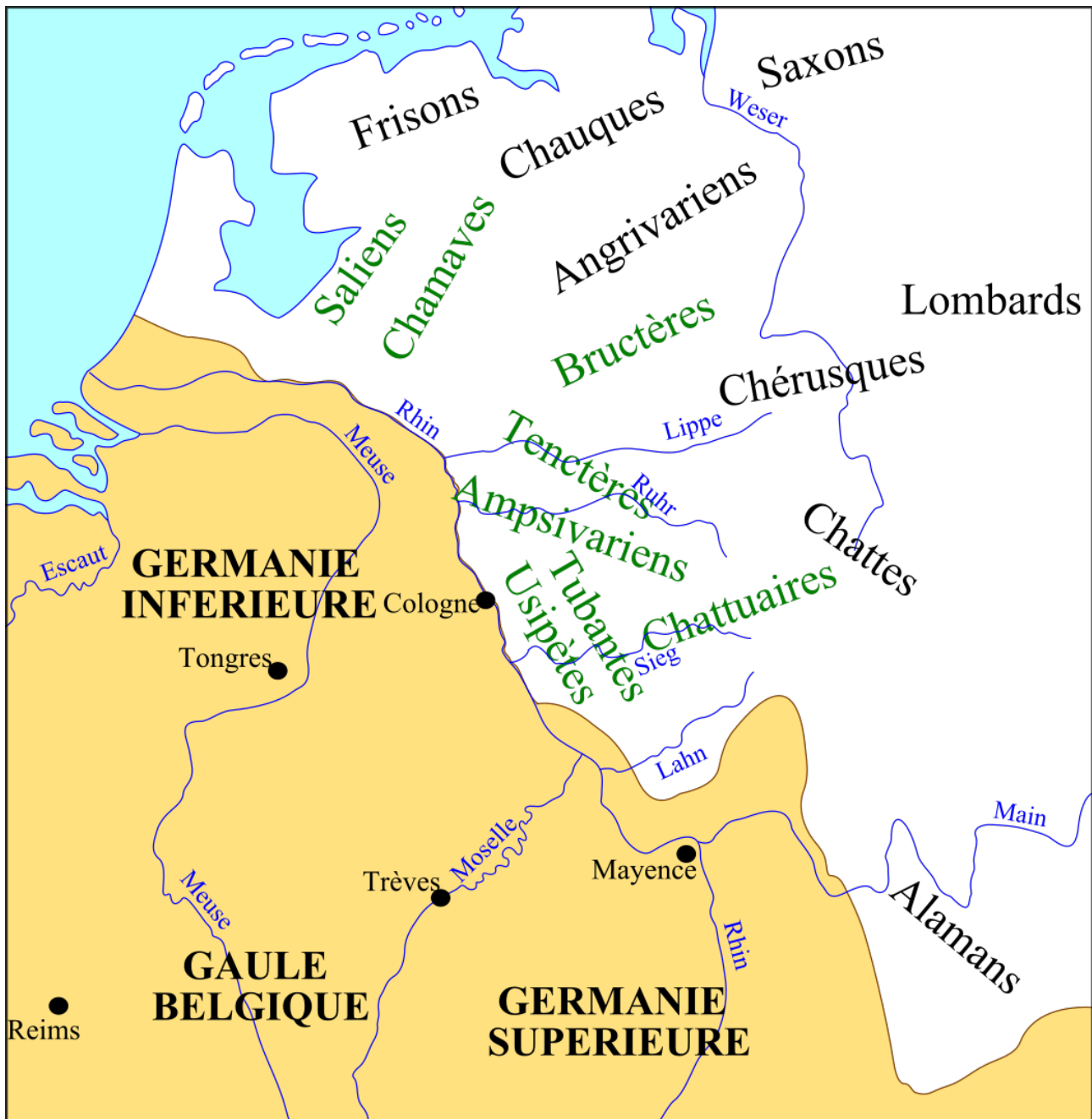
Carte des peuples francs (IIIe siècle)

Le déroulement des faits est très mal connu. On entrevoit que Childéric mourut à Tournai en 481 (sa tombe y fut retrouvée par hasard en 1653), puis que Clovis, en l'an V de son règne, vainquit Syagrius, fils et successeur d'Aegidius, enleva son quartier général, qui était à Soissons, et étendit sans doute, par là même, sa domination jusqu'à la Loire. Ce qui restait de l'armée « romaine » dut passer à son service, et lui-même fixa bientôt à Paris le centre de son pouvoir. L'élimination des rois francs concurrents de sa dynastie lui causa probablement plus de soucis : Grégoire de Tours, au siècle suivant, a des récits pittoresques et cruels sur la