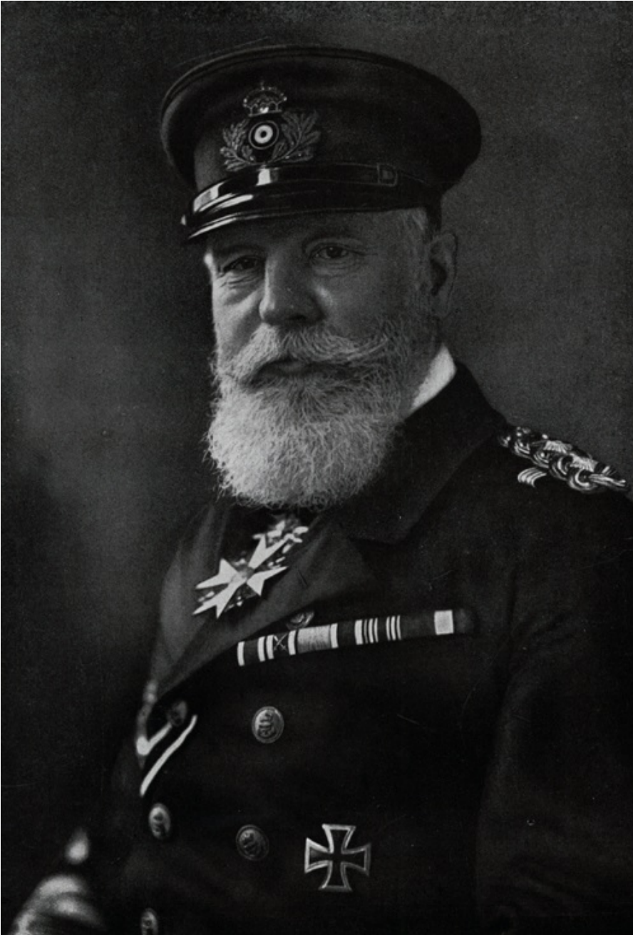
Amiral Hennig von Holtzendorff (1853-1919).

Dès la fin août, l'amiral von Holtzendorff, chef de l'Amirauté, s'adressa au maréchal von Hindenburg peu après son arrivée au commandement suprême pour lui signaler que la « Grande Flotte » anglaise ne sortait plus de ses bases et qu'on n'aurait plus l'occasion de lui livrer bataille ; de ce fait, il était absolument nécessaire d'agir le plus tôt possible contre le trafic maritime anglais. Les militaires s'étaient prononcés pour le renforcement de la guerre navale par le recours à la guerre sous-marine sans restriction. Le chancelier, lui, avait été d'un avis opposé, en arguant le mécontentement certain des neutres et l'hostilité des États-Unis