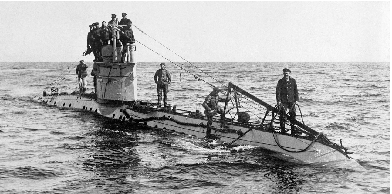
Sous-marin allemand, type UC.

La bataille n'avait pas été menée jusqu'à la décision. Dans un rapport de forces global de un contre deux, la Flotte allemande est en droit d'estimer qu'elle a remporté un beau succès tactique. Elle avait tenu face à l'incontestable supériorité britannique, son commandement et son matériel avaient fait preuve de qualités au moins égales à celles du commandement et du matériel britanniques. Ceci écrit, dans la mesure où, à compter de la bataille du Jutland, Scheer n'a plus tenté aucune sortie en Mer du Nord, et a maintenu sa flotte au mouillage, au niveau stratégique, la Flotte britannique avait recouvré la liberté absolue des mers.