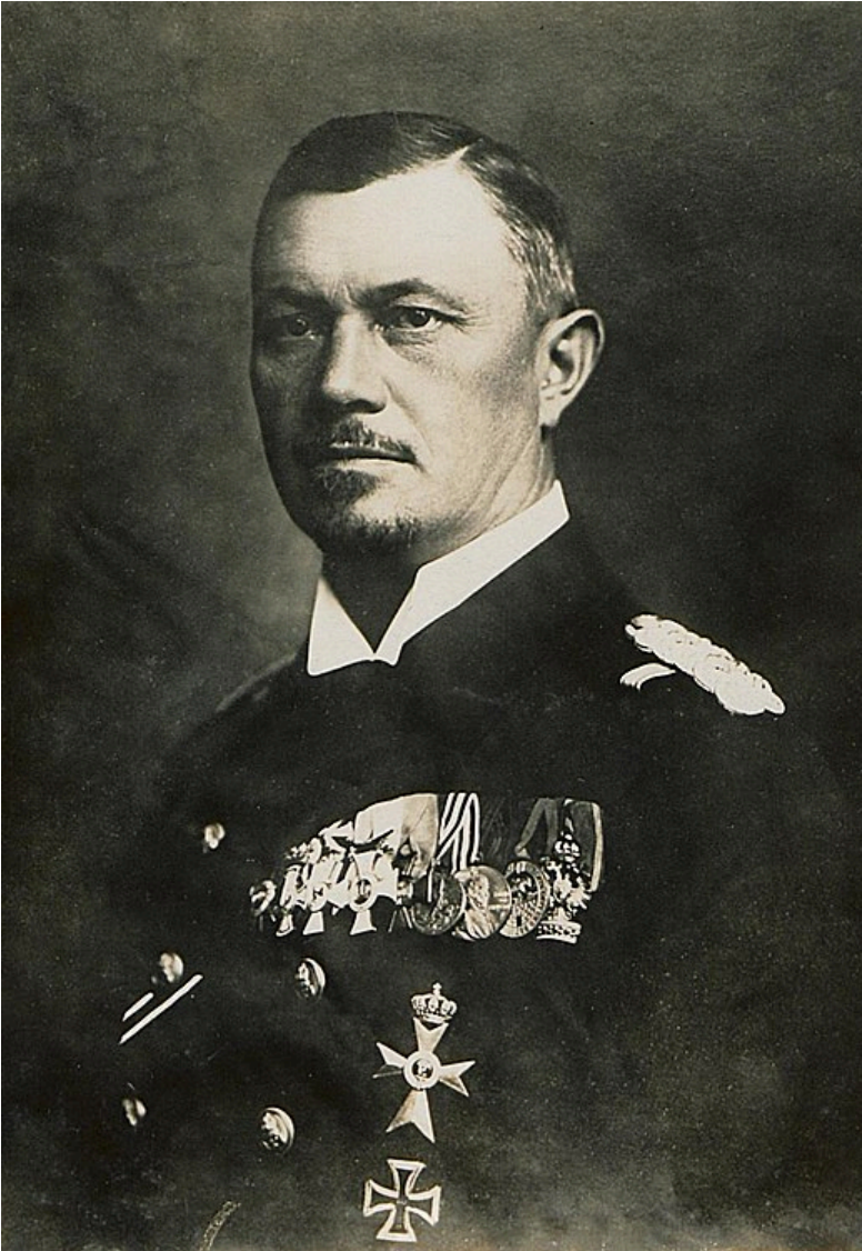
Amiral Reinhard Scheer (1863-1928).

L'amiral Scheer eut alors à décider s'il devait reprendre le combat, ses arrières bien adossés à la baie d'Heligoland. Les chances n'étaient pas grandes de remporter une victoire sur un adversaire deux fois plus puissant. Le fait que les bâtiments d'éclairage allemands, déjà peu nombreux en soi, ne possédaient plus qu'un faible potentiel de combat, conséquence de leurs pertes et de leur consommation de munitions, pesa lourdement dans la décision de Scheer de rompre définitivement le contact. Jellicoe, de son côté, ne se donna plus la peine de contraindre les Allemands au combat, ce qu'il eut été en situation de faire, soit que les expériences défavorables des jours précédents, les lourdes pertes et le voisinage menaçant d'Heligoland l'effrayassent, soit que la flotte anglaise ait été désorganisée par le combat et qu'il n'ait pas réussi à lui redonner cohérence et cohésion en temps voulu.