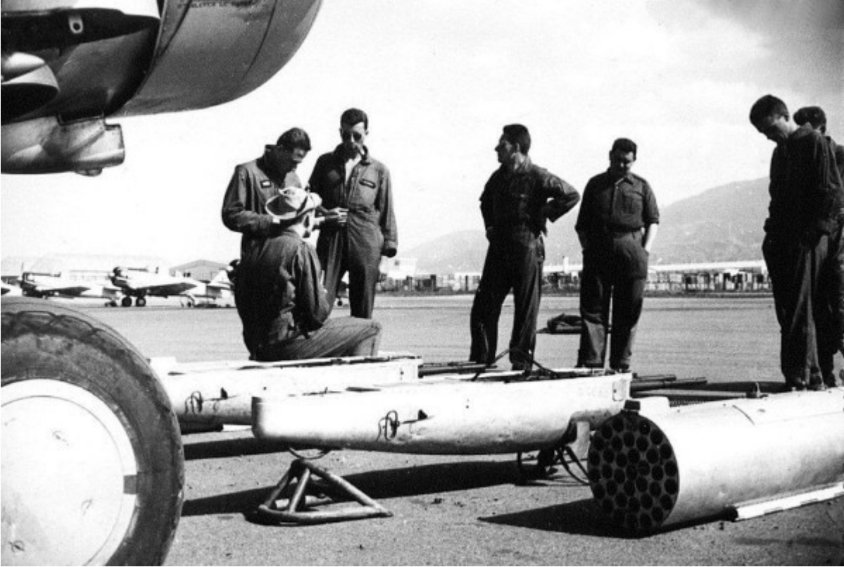
Paniers mitrailleuses et lance-roquettes SNEB

tirer 18 ou 36 roquettes SNEB de 37 mm ou 7 roquettes de 68 mm à fragmentation.