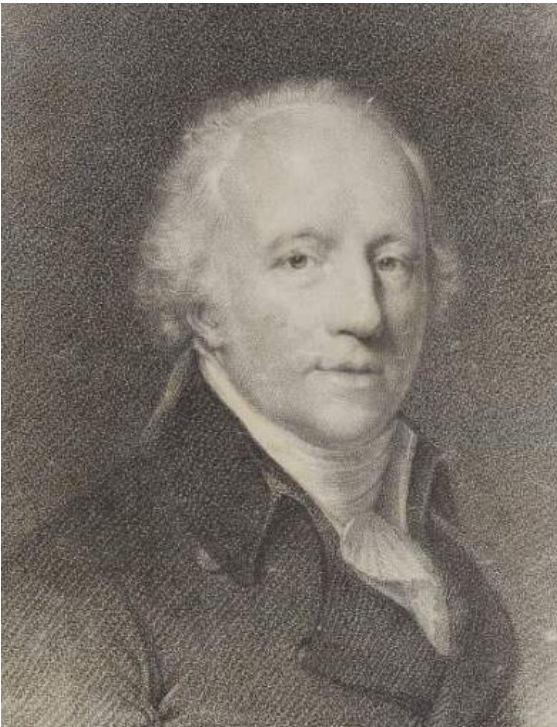
Richard Lovell Edgeworth (1744-1817).

Voltaire présenta obstinément l'idée du char de combat pendant quatorze ans. Dans sa correspondance, on ne trouve pas moins de six lettres sur la question, dont les destinataires vont du maréchal de Richelieu jusqu'à Catherine II. En vain invoquait-il un livre « qui n'a jamais menti » et où il trouvait que les Hébreux parvinrent à faire des milliers de chariots de guerre « dans un pays où il n'y avait auparavant que des ânes » . Il réussit à convaincre un ministre de la guerre, d'Argenson, qui en fit exécuter un modèle, mais non point ses généraux qui lui objectèrent — déjà — que le canon seul gagnait les batailles, et qui, dit-il, « ne voulurent point jouer à un jeu renouvelé des Perses » .