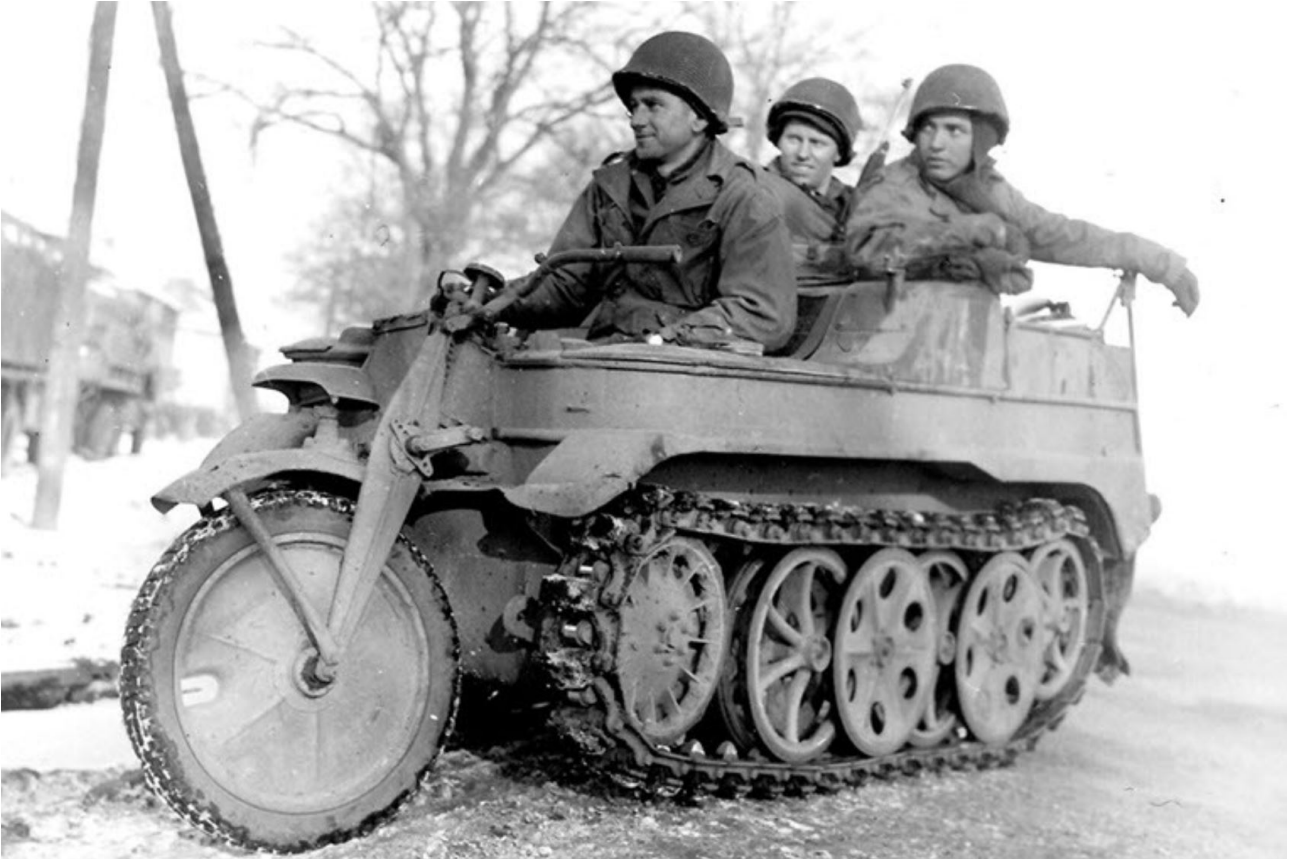
Kettenkrad allemand récupéré par des soldats américains.