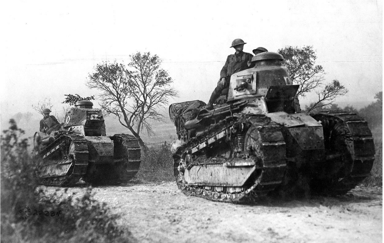
Renault FT en Argonne (1917).

Les autres pays, dont les réalisations ne commencèrent d'ailleurs à apparaître qu'en 1918, n'introduisirent pas de conceptions nouvelles.