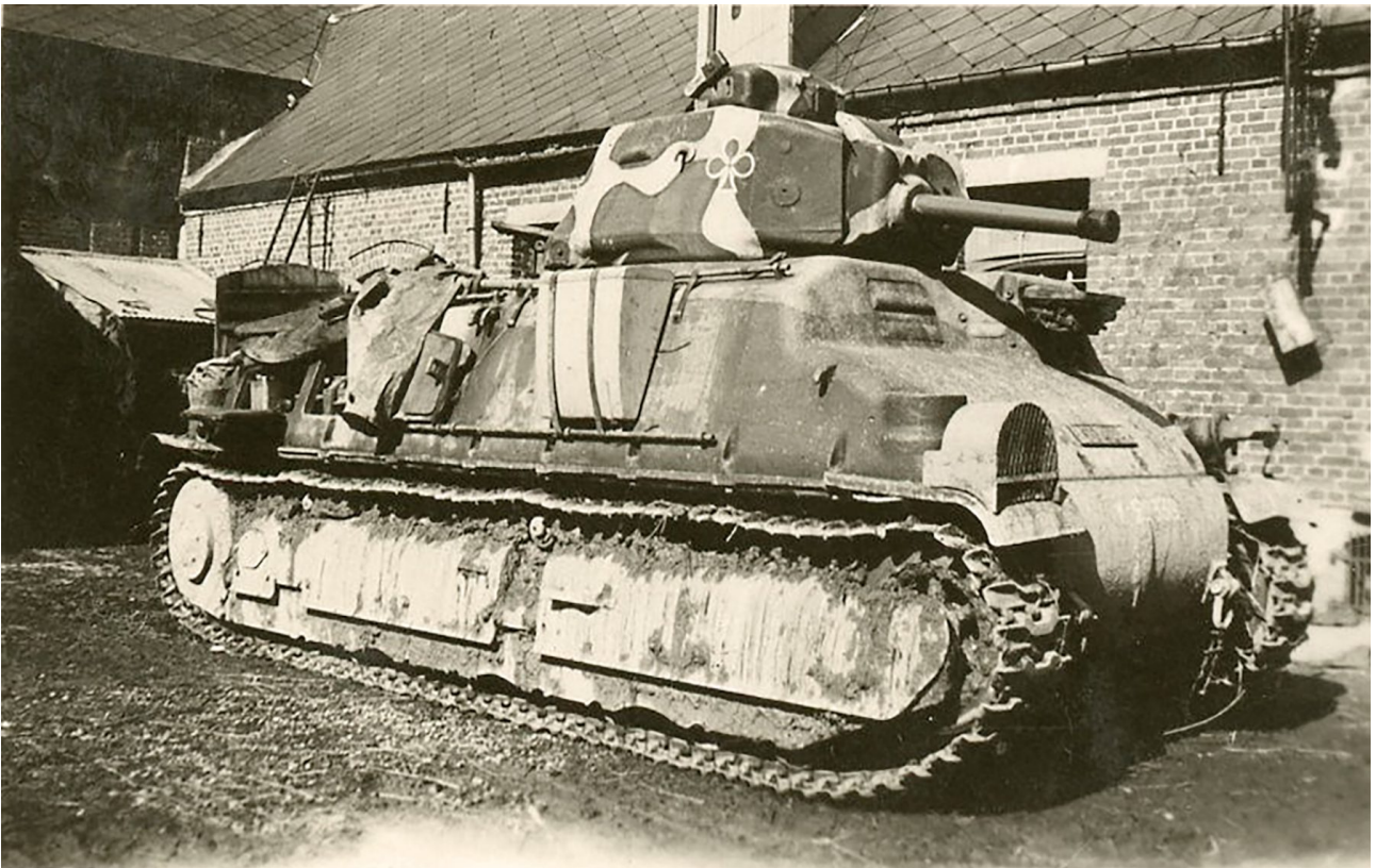
Char moyen SOMUA S35 de 28 tonnes, l'un des meilleurs matériels de 1939.

On sait aujourd'hui qu'il vaut mieux offrir au combattant cette « protection personnelle » qu'est un blindage de chars, si l'on veut simplement éviter la catastrophe. Mais on comprend qu'en 1934, lorsque le colonel de Gaulle présenta sa thèse, le climat n'était pas favorable à son adoption.