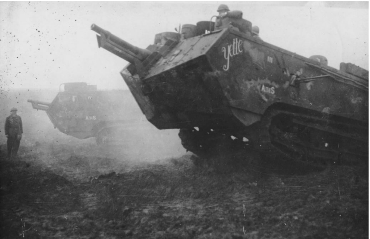
Chars Saint Chamond. « Ferme Mennejean, départ des chars le 23 octobre. »

ces engins confirma le général Estienne, alors colonel d'artillerie, dans l'idée que la réalisation de son projet de chars d'assaut était chose aisée. Le projet du général Estienne portait alors sur une voiture blindée de 7 tonnes avec un équipage de quatre hommes servant deux mitrailleuses et un canon de 37 et pouvant loger en outre une vingtaine de fantassins avec armes et bagages. Il s'exécuta finalement sous la forme de deux chars, le Schneider Mle 1916 , de 13,5 tonnes, armé d'un 75 raccourci et de 2 mitrailleuses, blindé à 17 mm, servi par six hommes ; le Saint-Chamond Mle 1917 , de 23 tonnes, armé d'un 75 et de 4 mitrailleuses, blindé à 17 mm, servi par neuf hommes ; on avait renoncé au transport de l'infanterie.