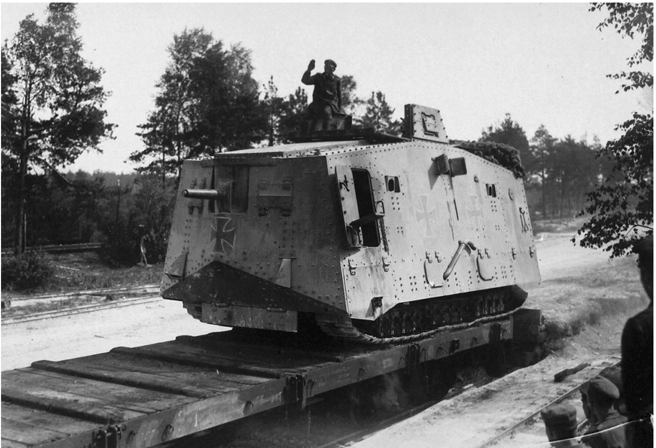
Char allemand A7V .

C'est dans cette intention que l'armée allemande porta à 30 mm le blindage de ses premiers chars de rupture, les A7V 1917, puis à 45 mm celui des chars A7VU 1918. Cette augmentation fut ratifiée en France avec les 30 mm de blindage du 2 C 1921, en Amérique avec les 25,4 mm des chars T1 , T1E1 , et T1E2 de 1921 à 1925. La Grande-Bretagne, avec ses Vickers des modèles 1922 à 1927, s'en tint aux blindages minces de 15 mm ; elle n'atteignit les 25,4 mm que sur les chars moyens Vickers-Armstrong de 1929. Le développement de cette tendance à se protéger contre des armes anti-chars spécialisées de plus en plus puissantes devait conduire aux protections de 40 à 60 mm des chars de 1939.