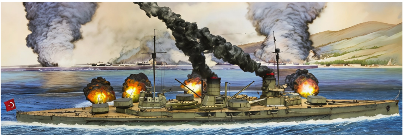
Le Yavuz ouvrant le feu sur Sébastopol.

La Russie réagit immédiatement et déclare la guerre le 2 novembre, suivie par la France et le Royaume-Uni le 5. L'entrée du Goeben et du Breslau dans les Dardanelles a transformé, en moins de trois mois, une neutralité fragile en engagement total.