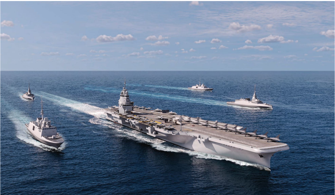
Esquisse du futur porte-avions de nouvelle génération (PANG). illustration : ministère des Armées – Naval Group.

Renforcer en moyens navals lourds positionnés en permanence outre-mer est en revanche une fausse bonne idée pour de nombreuses raisons. Militairement, cela éparpillerait nos forces, violant le principe de concentration nécessaire à l'obtention de résultats décisifs. Sur le plan du soutien, cela supposerait l'expansion d'infrastructures locales à un coût très élevé. Sur le plan humain, cela obligerait la Marine nationale à trouver des équipages disponibles, ce qui est déjà compliqué pour les formats actuels qui suscitent peu de volontaires, notamment pour les postes « un an sans famille ». Enfin, cela perturberait le cycle opérationnel, atomiserait la force d'action navale en trop de sous-groupes pour qu'il soit possible de maintenir un niveau d'entraînement homogène et, au final, ne ferait qu'exposer à l'attaque surprise d'un éventuel adversaire des forces qui seraient plus utiles regroupées pour une contre-attaque. Au bout du compte, la communauté nationale aurait sans doute dépensé plus d'argent et d'efforts que n'en coûte le maintien d'un groupe aéronaval, pour un rendement moindre.