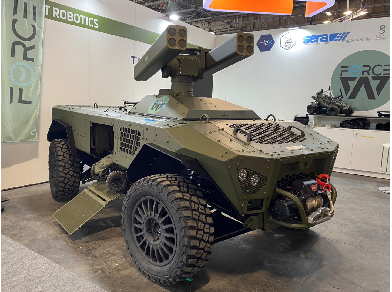
Le robot terrestre PHOBOS armé du système de roquettes activées par induction de THALES LAS-VTS France.

Les roquettes guidées laser activées par induction de Thales pourront être utilisées dans la capacité de tir au-delà de la vue directe (TAVD)