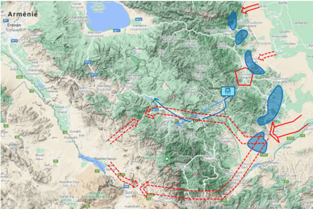
Prospective opérationnelle des mouvements azerbaïdjanais (en ligne continue les mouvements exécutés, en pointillés les mouvements prospectifs) - carte générée par l'auteur via MilitaryMap - https://www.map.army/ .

Parvenues à la frontière avec l'État national arménien, les forces azerbaïdjanaises seraient à la « croisée des chemins ». Si elles cherchent à faire leur jonction le long de la vallée de l'Araxe pour couper l'Iran de l'Arménie et restaurer leur propre continuité territoriale, elles prennent le risque de violer la souveraineté de l'Arménie. C'est la ligne rouge que vient de réaffirmer Vladimir Poutine. On a beaucoup insisté sur le fait que le président russe considérait que le Haut Karabakh n'était pas couvert par le pacte de l'OTSC. Mais il a aussi (surtout ?) rappelé que la Russie honorerait ses obligations au titre du pacte : une agression directe sur le sol arménien verrait l'intervention russe via le traité de l'OTSC [11] . Bakou ne peut se le permettre. Gageons que personne (pas même la Turquie) n'a envie d'une confrontation avec la Russie, surtout vu les succès et la modernisation des forces russes ces dernières années. Bakou, selon sa position plus ou moins forte et notamment le chantage « humanitaire » sur Stepanakert, pourrait même arracher une « internationalisation » du corridor de l'Araxe, ce qui serait déjà une immense victoire.