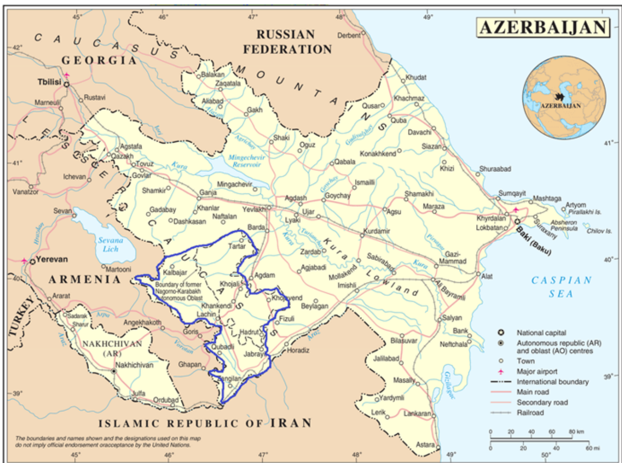
L'Azerbaïdjan, un pays divisé (en bleu, les territoires occupés par l'Arménie).

On a un peu vite résumé l'offensive azerbaïdjanaise à une volonté de « reprendre » (ou « libérer ») le Haut Karabakh et les territoires azerbaïdjanais occupés de facto par l'Arménie depuis 1994. Mais cet objectif est sans doute moins important que celui de la création d'une continuité territoriale. En effet, il faut garder à l'esprit que l'Azerbaïdjan est un État « divisé en deux » : la province de Nakhitchevan est séparée du reste du pays par le territoire arménien ( marz de Syunik). Cette division est un vieux « problème » pour l'État azerbaïdjanais, d'autant que le territoire iranien qui pourrait aider à former un « corridor » est plutôt hostile.