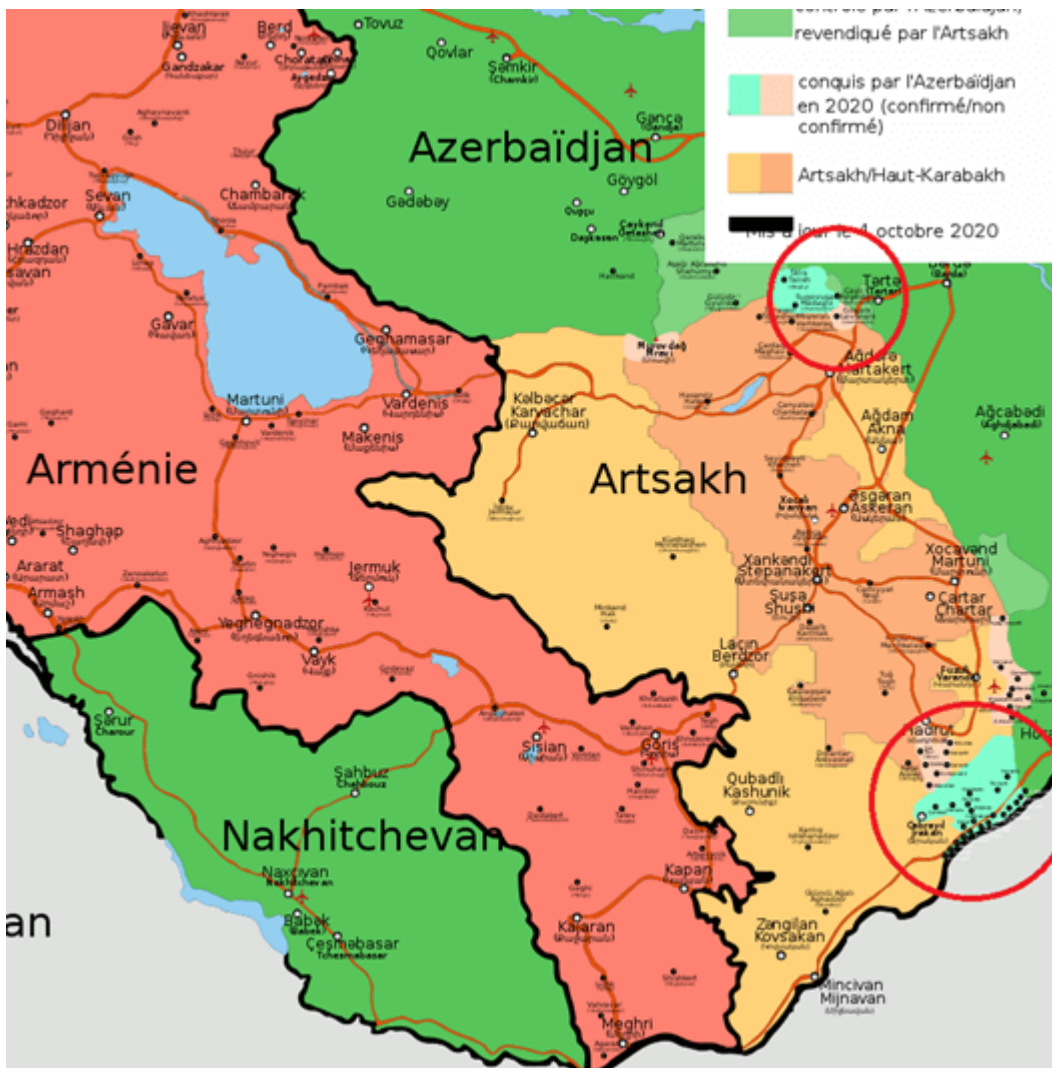
Zones d'effort initial de l'armée azerbaïdjanaise (en rouge).

D'une part, l'essentiel de l'offensive a lieu non pas vers les territoires du Haut-Karabakh, mais dans des territoires azerbaïdjanaïses, occupés par l'Arménie (occupation dénoncée comme telle par le Conseil de sécurité des Nations unies). Il s'agit donc bien, en droit international, d'une forme de « libération », ce qui est bien plus défendable en cas de négociations.