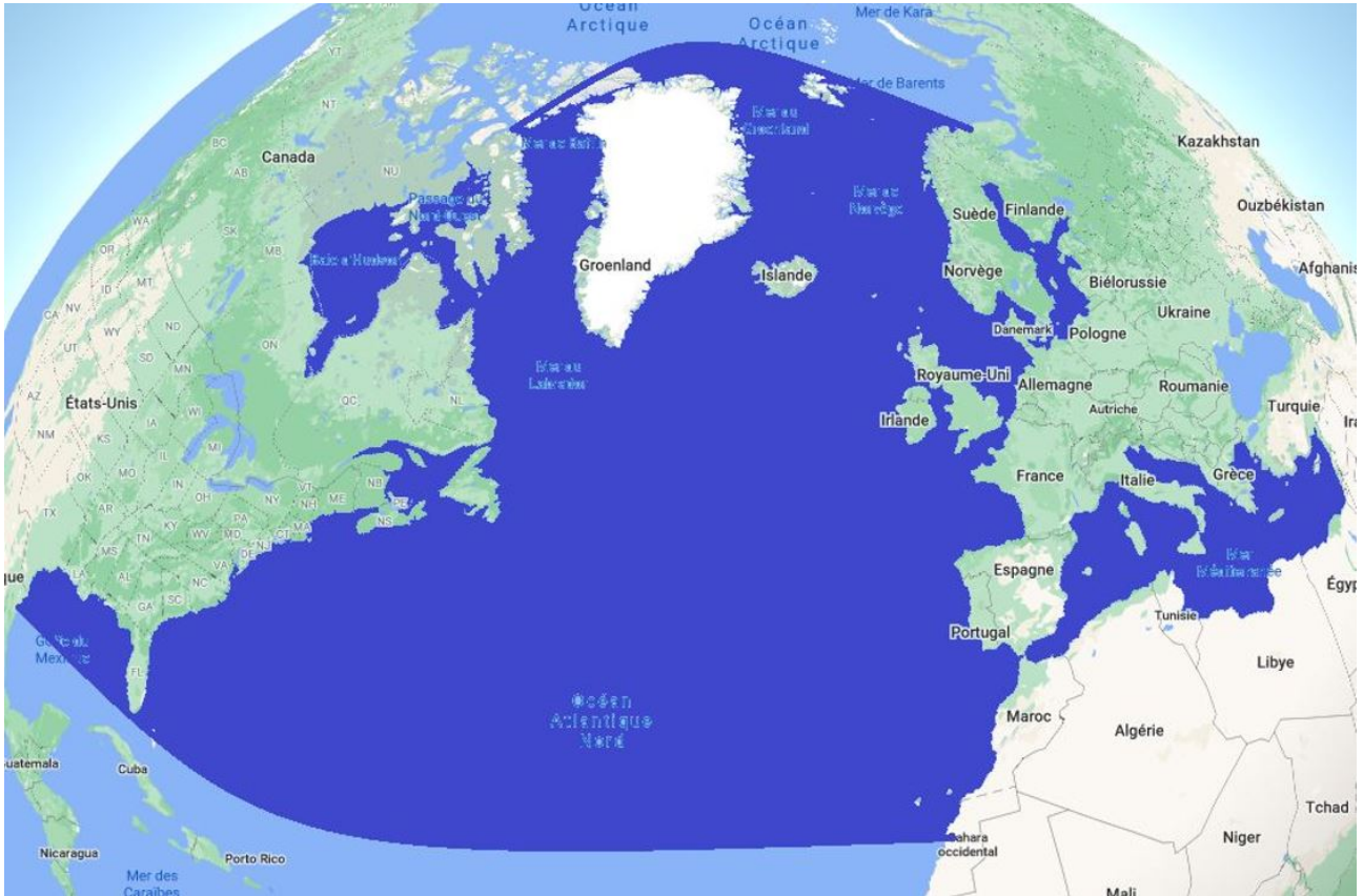
Espaces maritimes (en bleu foncé) couverts par le Traité de l'Atlantique nord, qui concerne, en outre, la totalité des territoires nationaux en Europe et Amérique du nord.

Ainsi, même si l'océan Pacifique n'est pas une zone couverte par l'Alliance (qui ne protège donc pas les territoires français de la région, pas plus que les îles Hawaïi), la sécurité continentale des Alliés en Amérique du Nord, même dans leur façade Pacifique, est bien dans la zone de défense de l'Alliance.